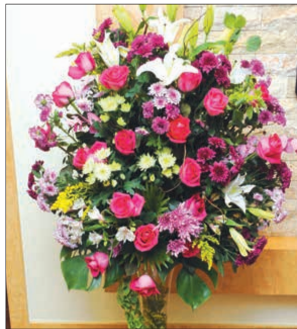
زهرة من رئيس اللجنة الأولمبية الكويتية الشيخ دلال الفهد في عيد «الأنباء» (فبراير حماد)

قراءها ينقل الأخبار والوقائع والأحداث على نهج صحافي قويم ومحاييد، اختطته في سياسة إعلامية رشيدة مكنتها من التقدم والارتقاء بالصحافة الكويتية، وفي استخدام التقنية الحديثة