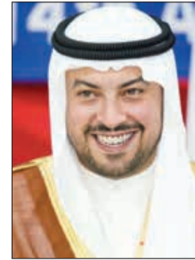
الشيخ د.دلال الفهد