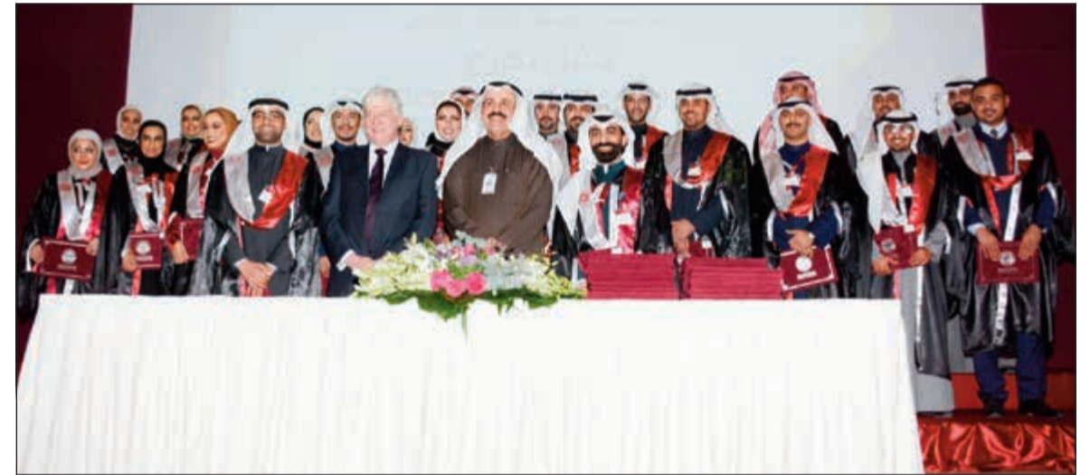
لقطة جماعية للخريجين مع المدير العام ومدير التدريب