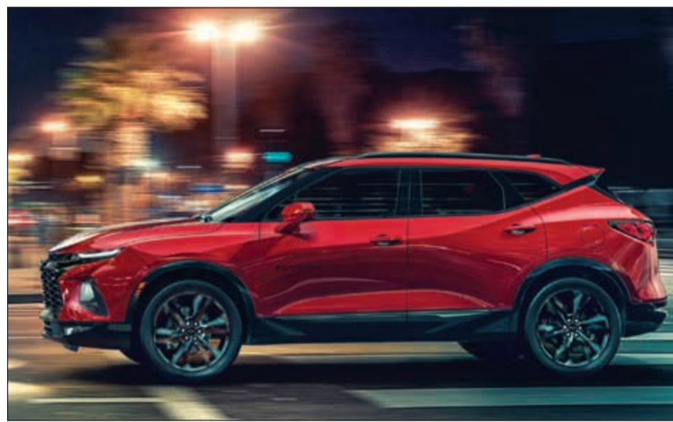
بليزر 2019 305HP 3.6L