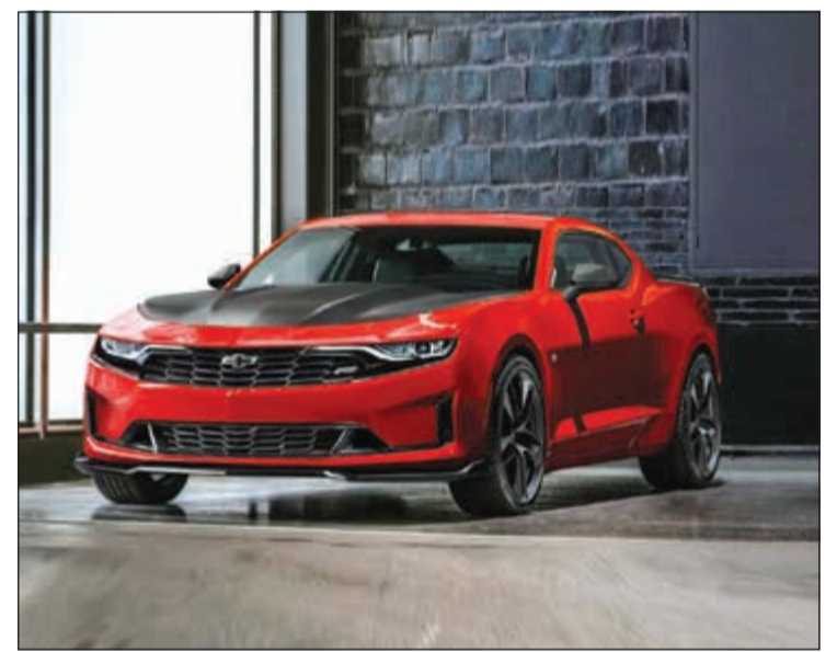
كامارو 2019 455HP 6.2L V8

العجلات الأميركية وضعت قيادة مختلفة تشمل القيادة الرياضية، التجوال، القيادة في الوضعية الثلوج/ الجليد، أو الوضعية الحرة ووضع الحلمات (متاحة في طراز SS فقط). وتعد التكنولوجيا المتقدمة من أكثر ما يميز هذه السيارة الجديدة بالكامل، إذ تمكن السائق من بدء الرحلة بكبسة زر والاستمتاع بالزياب المتطورة مميزة العرض الملمس على الزجاج الأمامي وعتبات الأبواب المنارة بالإضافة للعديد من الخصائص التكنولوجية التي تتضمن شفروليه مايلينك® للتحكم الإلكتروني بالثبات وكاميرا الرؤية الخلفية مع نظام المساعدة على الركن الخلفي، بالإضافة إلى الوسائد الجديدة لمنطقة ركبة السائق والراكب الأمامي.