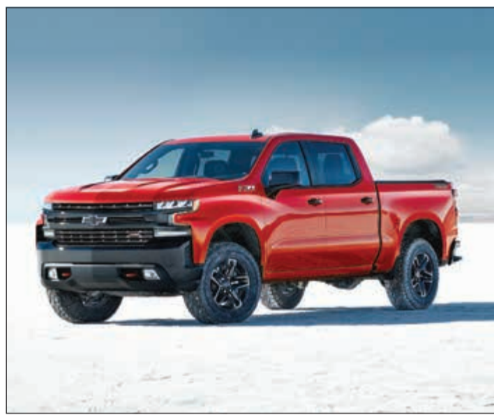
سيلفرايو 2019 355HP 5.3L