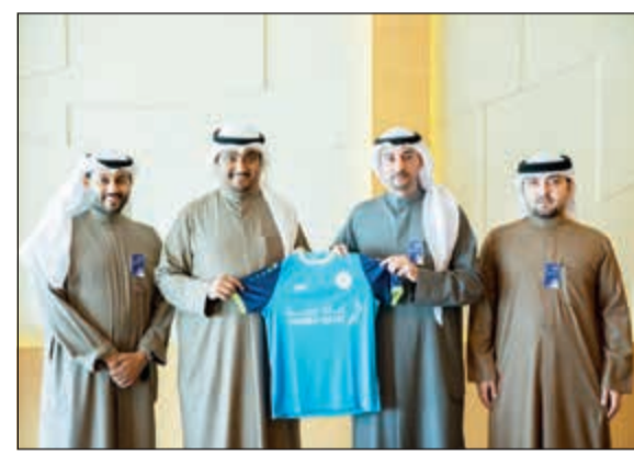
جانب من توقيع اتفاقية الشركة