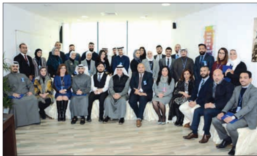
صورة جماعة للخريجين الجدد

احتفل بنك برقان مؤخرًا بتخريج دفعة جديدة مكونة من 12 متدرباً من أكاديمية بنك برقان لحدفي التخرج، تحت إشراف قسم التعلم والتطوير، حيث يحرس البنك على رفح مستوى تميز وأداء الشباب الخريجين وتزويدهم بالخبرة المصرفية اللازمة. وانطلاقاً مما تقدم وفر البرنامج للخريجين الجدد المؤهلات اللازمة والمهارات المهنية الأساسية والخبرة الميدانية لأداء عملهم بكل نجاح وكفاءة، حيث يركز البرنامج على عدة مجالات أساسية، بدءاً من القيم الجوهرية لبنك برقان، وثقافة المؤسسة، وصولاً إلى معايير العمل، الأداء، الجودة، العلامة التجارية وأهداف البنك الاستراتيجية، وبفضل هذا البرنامج اكتسب المتدربون خبرة حول نماذج العمل المصرفي، والمعايير التنظيمية والبنكية الدولية، وتكوين معرفة تقنية وتشغيلية مكثفة، كما أتاح البرنامج للخريجين فرصة لإبراز آرائهم وإظهار خبراتهم الجديدة في نطاق المبيعات وخدمة العملاء، ويذكر أنه