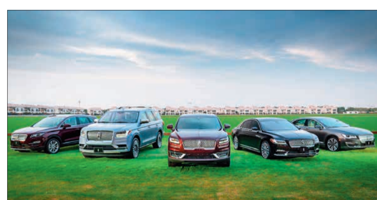
مجموعة منتجات لينكون لعام 2019

كونتيننتال، السيدان بالحجم الكامل التي توفر الفخامة الهادئة للعملاء الأكثر فطنة في المنطقة باناعتها وسكونها وقوتها السلسة. تؤمن لينكون كونتيننتال للعملاء في الشرق الأوسط رحلات فاخرة تفضفي الدفء ولسمات بشرية راقية وتصميماً عصرياً. فهي مصممة لتلتفت أنظار العملاء المتقنين الذين يحدون الفخامة تبعاً لشروطهم الخاصة ويتوقون إلى الجودة العالية والمهارة الحرفية والسلامة. وبفضل محرك V6 الثنائي الشحن التوربيني سعة 3 لترات المذهل الذي ينتج قوة تصل إلى 400 حصان فإنها مصممة لتؤمن قوة سلسة متجاوبة ولكن هادئة في الوقت عينه. ويترافق نظام الدفع بكل العجلات المتوافر مع نظام توجيه عزم الدوران الديناميكي الذي يوزع عزم الدوران عند الطلب إلى العجلات الخلفية المناسبة عند سلوك المنعطفات، ما يؤمن قدرة تحكم مفعمة بالثقة والثبات.