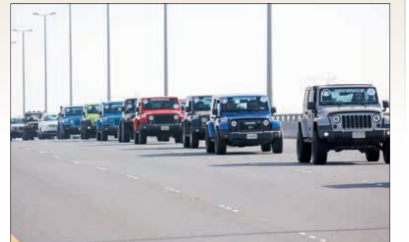
موكب السيارات المشاركة