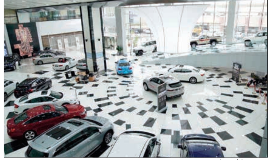
معرض سيارات «بيتك»

ويمكن للعملاء الاستفادة من هذا العرض أيضا عند دفع فواتير الهاتف النقال أو فواتير وسائل الترفيه مثل تذاكر السينما، OSN BeIN وNetfix ويحصل العملاء على فرصة الاسترجاع المضمون عند استخدام بطاقاتهم محليا ودوليا على الشكل التالي: فواتير الهاتف النقال 10%، وسائل الترفيه 5%، محلات السوق الحرة