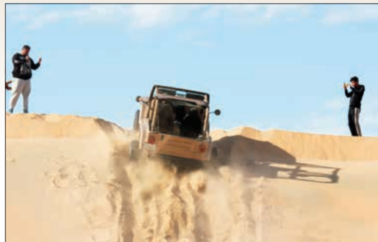
جانب من المسابقات