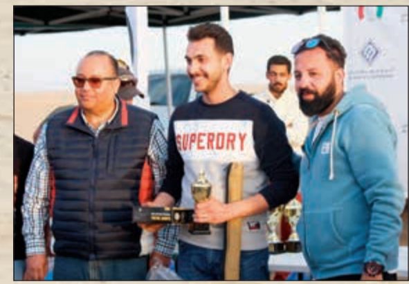
توزيع الجوائز على الفائزين

عجابههم بتضاريس صحراء الكويت التي تعتبر بيئة مثالية لاختبار قدرات جيب الأسطورية. وقد تخللت الفعالية العديد من المسابقات الشيقة، منها مسابقة «ساند دراغ» ومسابقة «اتحدى نفسك» وكذلك مسابقة «فك غرزتك»،