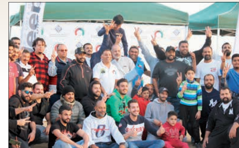
صورة جماعية لأعضاء نادي موبار الكويت

وبدأت الفعالية الساعة التاسعة صباحا حيث بدأ التجمع في متحف