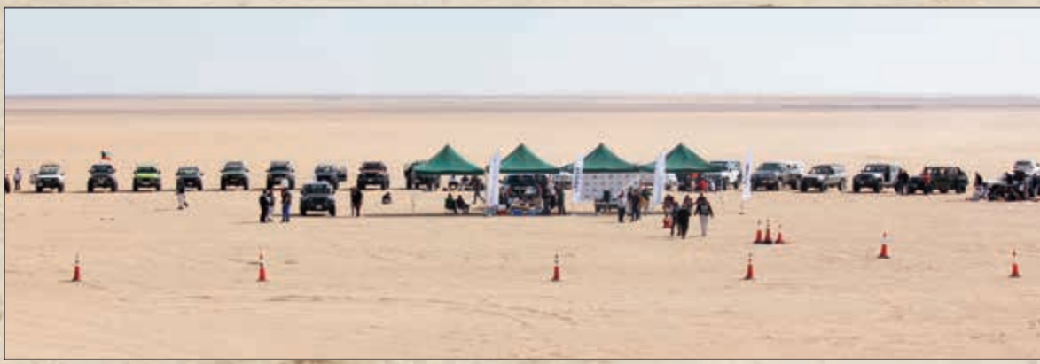
لقطات من الفعالية

وقد لاقت المسابقات صدى واسعا لدى المشاركين الذين استمتعوا بالأجواء التنافسية الممتعة والتي نتج عنها تنويع ثلاثة فائزين لكل مسابقة، وقد تم إهداء الفائزين جوائز قيمة مقدمة من الملا وبهبهاني، وقد جرت المسابقات في أجواء حماسية وتشجيع لكل المتسابقين المشاركين في المسابقات المتنوعة، كما استمتع المشاركون بتجربة قيادة سيارات «جيب» واختبار قدرات الدفع الرباعي والتي تتميز بها هذه الأيقونات ويعتبر نادي موبار الكويت والذي أنشأ عام 2012 من أهم نوادي السيارات في الكويت والذي يجمع عشاق سيارات كرايسلر - جيب - دودج ورام في الكويت والتي يعشق سائقوها روح المغامرة والتحدى.