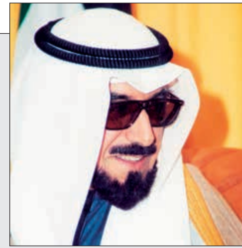
الأمير الراحل الشيخ جابر الاحمد (رحمه الله)

الكويتيون يستذكرون اليوم الذكرى الثالثة عشرة على الرحيل.. جابر الأحمد نذر نفسه للكويت وقاد سفيتها لبر الأمان