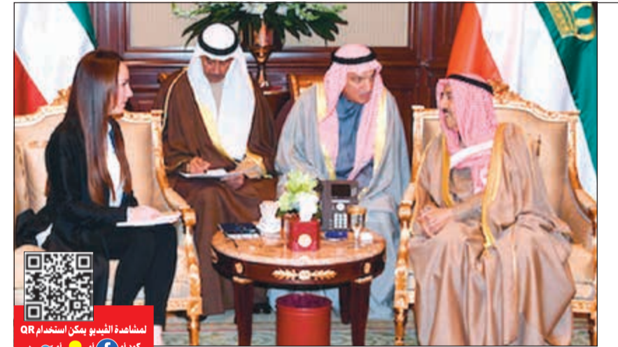
صاحب السمو الأمير الشيخ صباح الأحمد مستقلاً رئيس الاتحاد البرلماني الدولي غابرييلا بارون

قالت مصادر حكومية رفيعة في تصريحات خاصة لـ «الأنباء» إن زيادة البدلات المالية للمعلمين أصحاب التخصصات النادرة، أو إضافة صفة الندرة إلى تخصصات أخرى، تحتاج إلى تقديم مشروع قانون بتعديل القانون المطبق الآن. وأوضحت المصادر: إن إلغاء صفة الندرة عن تخصصات حالية يتم تنفيذها للقانون ولا يمكن وقف ذلك بقرار. وذكرت أن ما يتردد عن إمكانية إصدار قرارات بتنفيذ أي تعديل على ضوابط صرف بدلات التخصصات النادرة للمعلمين لا يمت للحقيقة بصلة. وشددت على أن وزارة التربية لا تملك إلا الالتزام