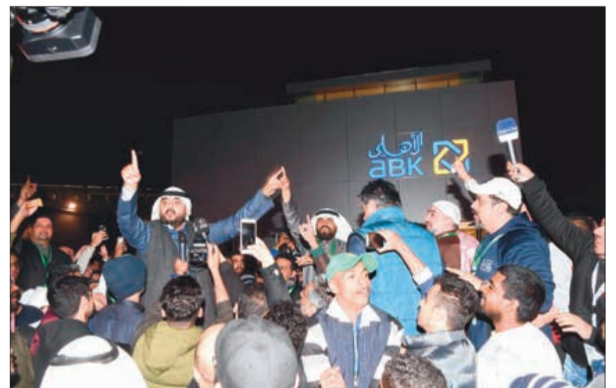
فرحة أنصار قائمة «أبناء النادي»