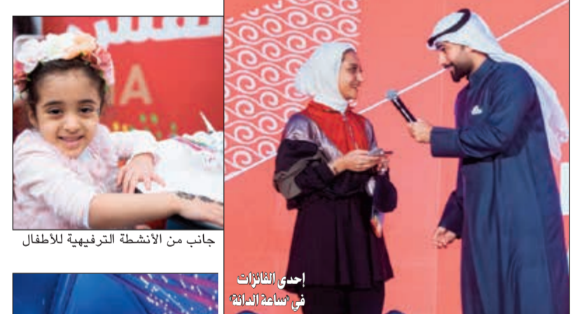
جانب من الأنشطة الترفيهية للأطفال

مسابقة صيد الكاش وقد ضمت الفعالية مسابقة «صيد الكاش» الشهيرة والتي يقدمها بنك الخليج حصريا، حيث سجل مئات الحاضرين للمشاركة فيها وبمجرد بداية البرنامج الترفيهي تم اختيار المشاركين عن طريق القرعة. وقد ثبت أن هذه اللعبة هي المفضلة للكثيرين، حيث تمنح المسابقة المشاركين فرصة دخول صندوقين بهما أوراق نقدية لجمع أكبر مبلغ خلال مدة عشر نوان. وبلغ إجمالي الجوائز النقدية المقدمة من خلال المسابقة 3000 دينار.