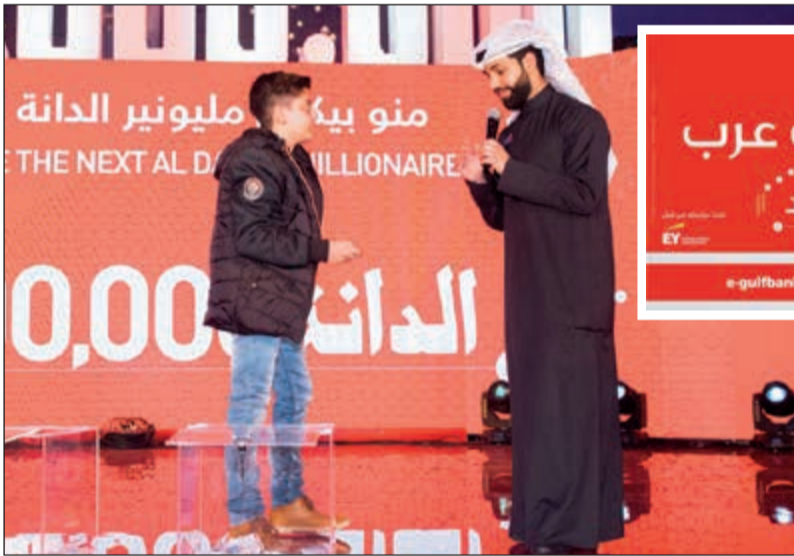
مليونير العام الماضي على المسرح