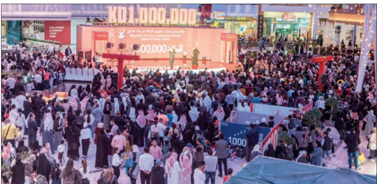
الجمهور الحاضر للفعالية