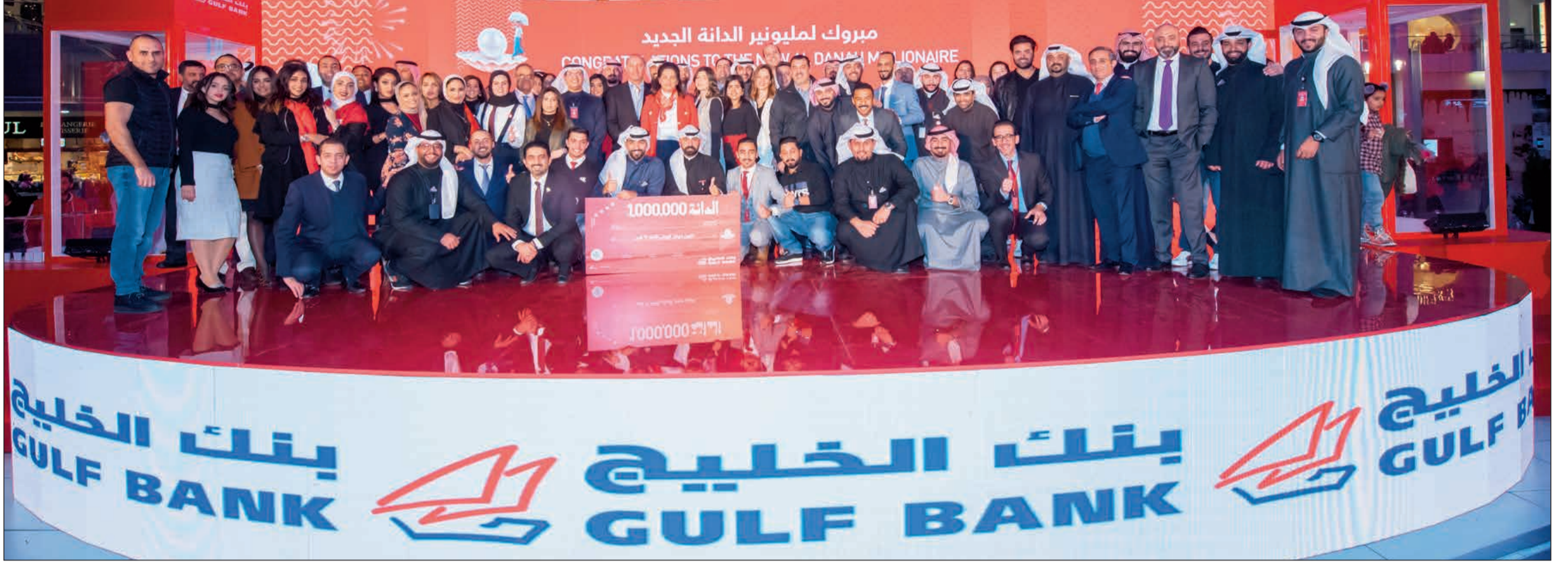
فريق عمل بنك الخليج