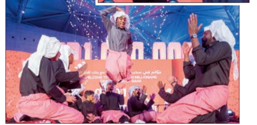
عرض فرقة المسة الشعبية