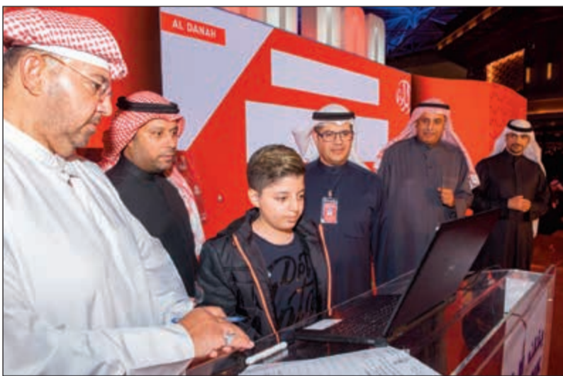
لحظة إجراء السحب