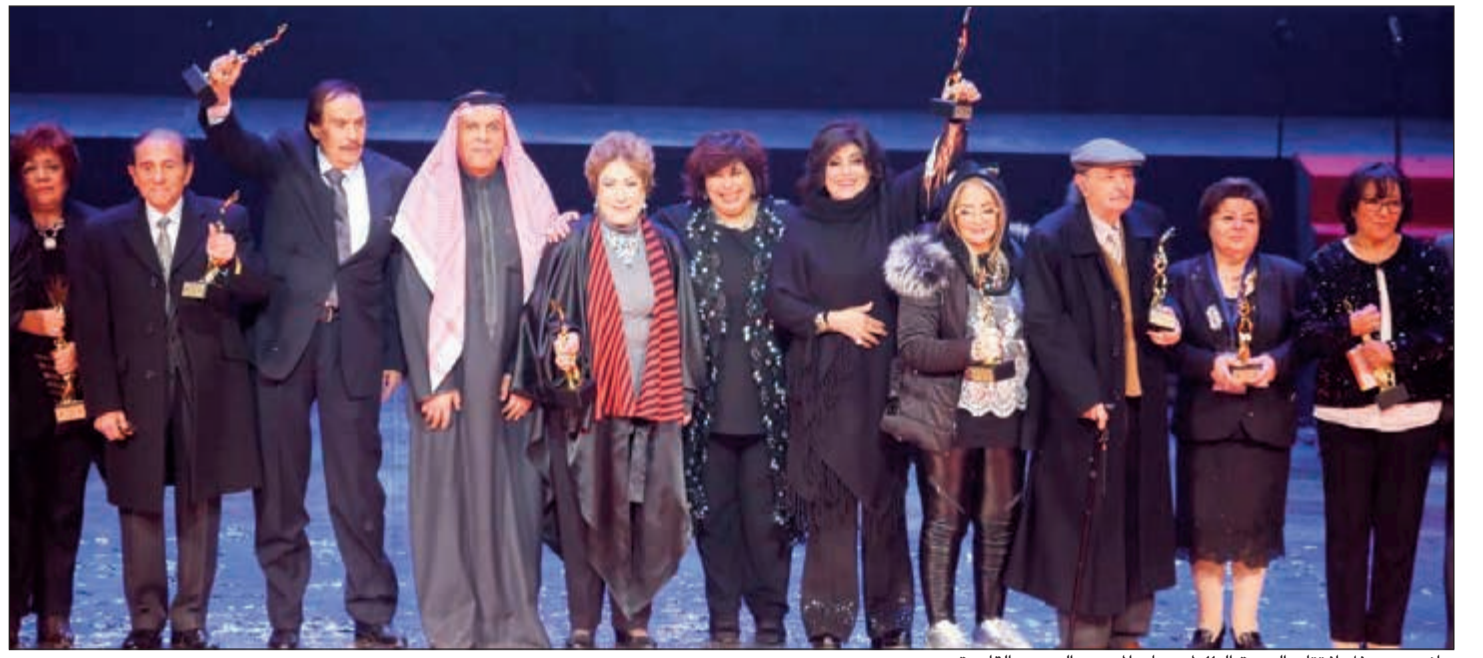
جانب من حفل افتتاح الدورة الـ 11 لمهرجان المسرح العربي بالقاهرة