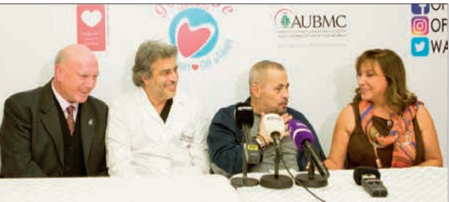
الوسوف أثناء المؤتمر

تشوه خلقي في القلب، ونصف هذا العدد بحاجة لإجراء عملية جراحية فورية لأن هذا المرض هو السبب الرئيسي لموت الأطفال تحت عمر السنة. وشكر د.فادي بيطار رئيس قسم الأطفال بمستشفى الجامعة الأمريكية بدوره الفنان جورج وسوف على مساعدته، مذكراً بمسيرة أبووديع التي تكملت بالنجاح وبالإنسانية أيضاً، وقال: هذا النهار مميز وخاص بتاريخ هذا المركز بزيارة أبووديع شخصياً.