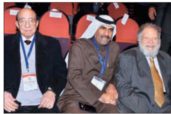
«الأنباء» تتوسط الفنانين القديريين يحيى الفخراني وجمال الشراوي

والمهتمين بشؤون المسرح العربي. ومن جانبها ألقى وزيرة الثقافة المصرية د.إيناس عبدالدايم كلمة تمت فيها طيب الإقامة في مصر والتجاذب لهذه الدورة، ومن ثم قرأ الفنان الجزائري القدير سيد احمد اقومي رسالة مهرجان المسرح العربي لعام 2019 أوضح فيها عشقه للمسرح الذي لا يموت والذي لا يقارنه أي فنون أخرى.