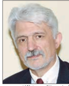
السفير د.فلاديمير تولكاش