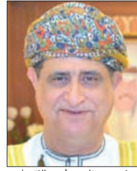
السفير د.عدنان بن أحمد الانصاري