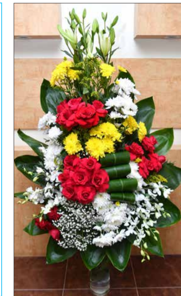
مطبخ العجمي وجمعية المعلمين قدموا الزهور في عيد «الأنباء»