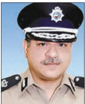
اللواء جمال الصايغ

بشكل مركز المركبات التي تتوقف صف ثان وتعيق حركة السير على شارع كنداراي. وتأتي حملة رجال مرور العاصمة في إطار حملات مشابهة يقوم بها رجال المرور برئاسة اللواء جمال الصايغ في مختلف المحافظات لتحقيق الضبط والربط. والتقليل من الحوادث المرورية الناجمة عن عدم الالتزام بالقانون