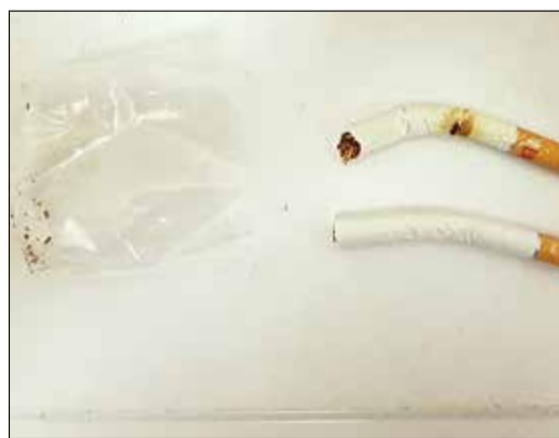
.. والسجاائر التي ضبطت بحوزة الوافد العربي