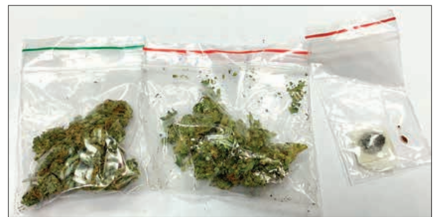
أكياس الماريغوانا المضبوطة بحوزة الخليجي

لموطنه فأوقفه واصطحبه للتفتيش اليدوي وعثر معه على سيجارتين بهما مخدر الحشيش. وذكر عضو لجنة الإعلام الجمركي في الإدارة العامة للجمارك نواف المطر أنه تم تحرير محضري ضبط بالمواد المخدرة للخليجي والعربي وإحالتهم إلى الجهات المختصة لاتخاذ ما يلزم من إجراءات، مشيراً