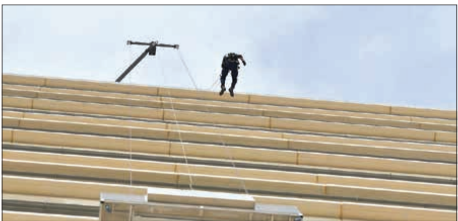
أحد رجال الإطفاء يتجه للطابق 13 بواسطة الحبال من سطح المبنى خلال التمرين

حوادث المستشفيات لتعزيز دور الموظفين في حالات الطوارئ وتنمية مهاراتهم بالتصرف الصحيح وتمكين رجال الإطفاء من التعرف على طبيعة مبنى المستشفى الجديد لتوفير أقصى درجات الحماية للأرواح والممتلكات. وكان سياريو التمرين عبارة عن وجود تسرب مواد كيميائية وإشعاعية في سرداب برج A نتج عنه وقوع عدد من الإصابات اندلاع حريق في الدور الثالث.