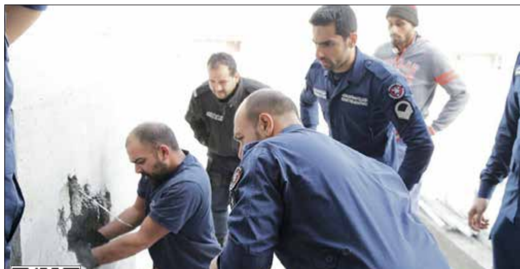
رجال الإطفاء يستحثون ثقباً في الخرسانة الأسمنتية لإنقاذ العامل