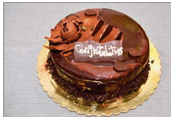
كيكة من فندق مركز المؤتمرات والرويال سويت