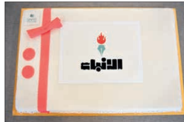
كعكة من فندق وريزيدنس سفير الفنتاس في عيد «الانباء»