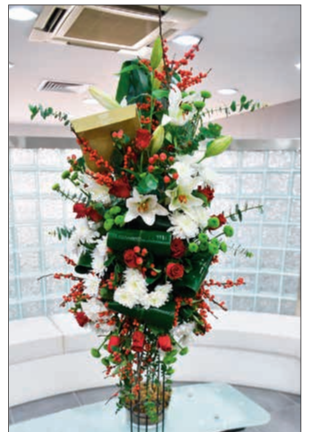
زهور من جميرا فندق ومنتج شاطئ المسيلة