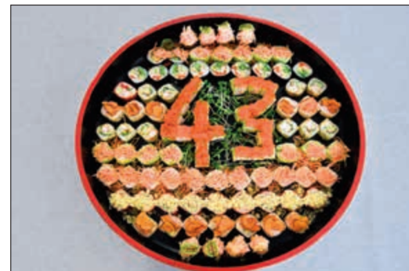
طبق سوشي من «ماكي»