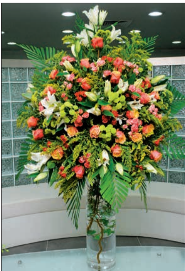
زهور «هواوي» الكويت زيتت «الأنباء»