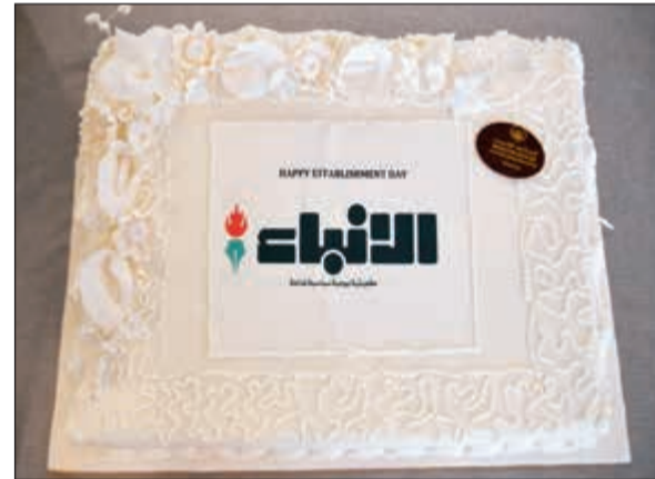
كيكة من شيراتون الكويت في عيد «الأنباء»