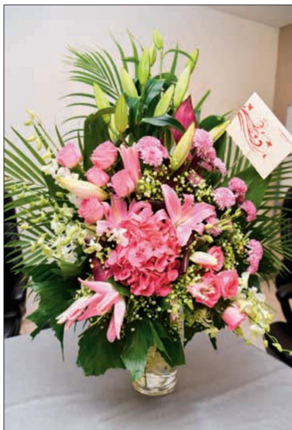
زهور من أسرة «اكشن» لـ «الأنباء»