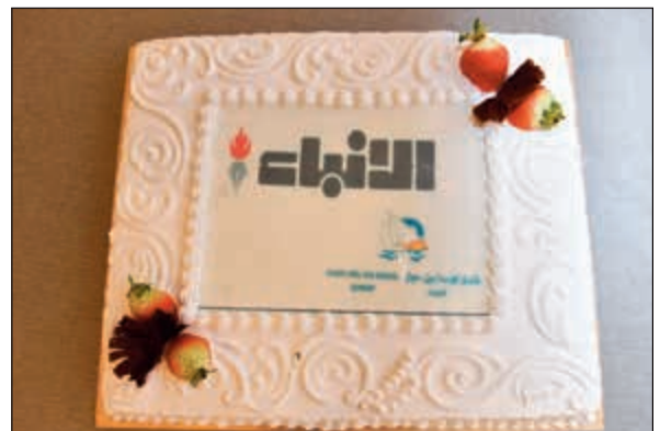
كعكة من فندق كوستا ديل سول في عيد «الانباء»