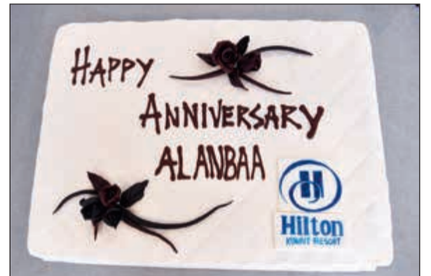
كعكة من هيلتون الكويت