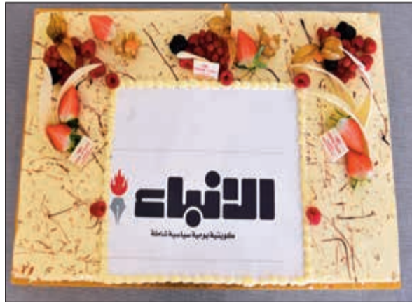
كيكة من كراون بلازا الكويت الثريا سيتي/ فندق هولديا إن الكويت الثريا سيتي