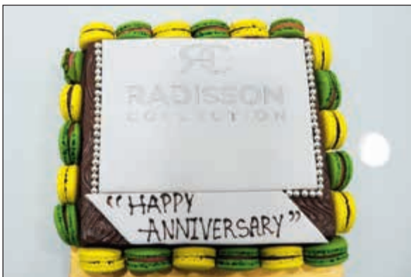
فندق سيفوني الكويت أحد فنادق راديسون كوليكشن قدم كعكة بالمناسبة