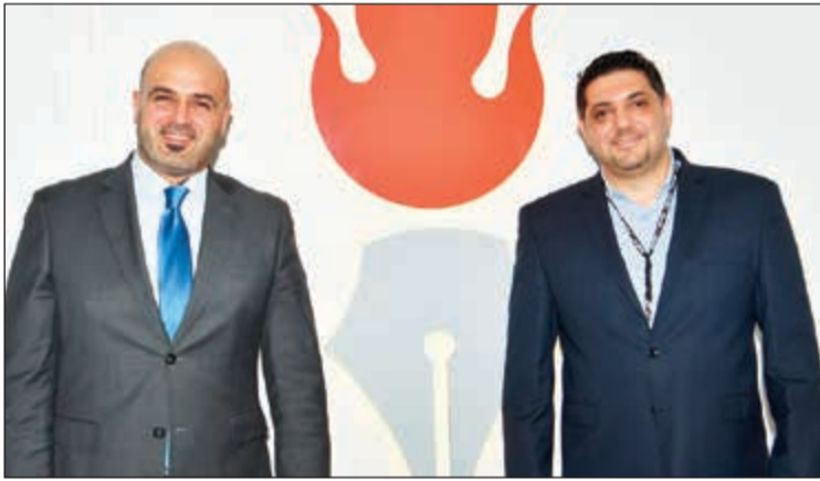
وسام انجبار من أسرة فندق ماريينا يهنئ «الانباء»