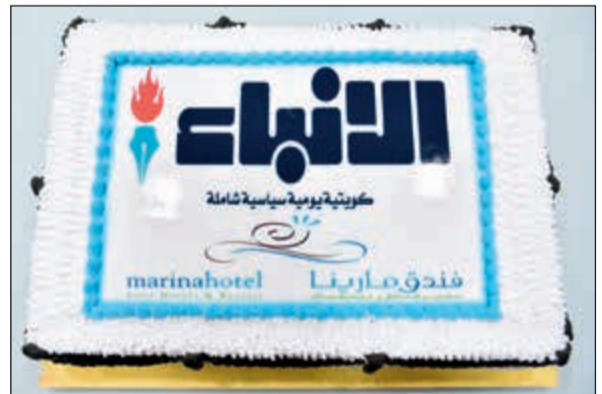
كعكة من أسرة ماريينا لـ «الانباء»