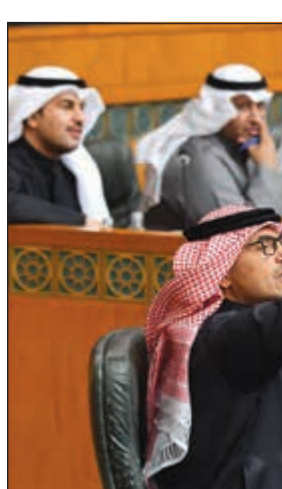
اعتراض على تقرير «التشريعية»