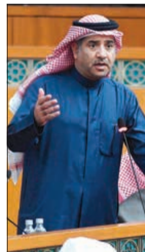
د عودة الرويعي