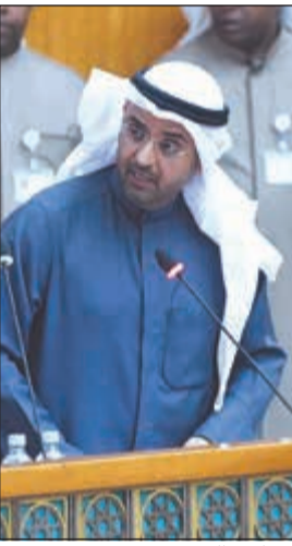
د. نايف الحجرف

وهناك رأي قانوني في هذه الجزئية وكتب العدل جهة رسمية، فكيف يكون تزويري في جهة رسمية، والبند التاسع فتمت بعد الحصول على رأي قانوني وسنبحث في هذا الموضوع ونحن نعمل وسنوافي الأخ الحميدي بالمعلومات، وهي ما يتعلق بصرف المكافأة والمستحقات. - سؤال النائب عبدالله الرومي من مركز جابر الأحمد الثقافي.