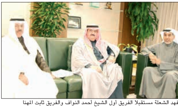
فهد الشعلة مستقبلاً الفريق أول الشيخ أحمد النواف والفريق ثابت المنها

استقبل وزير الأوقاف والشؤون الإسلامية وزير الدولة لشؤون البلدية فهد الشعلة محافظ حولي الفريق أول الشيخ أحمد النواف، ومحافظ العاصمة الفريق ثابت المنها أمس في مكتبه بوزارة الأوقاف. وبحث الشعلة مع المحافظين القضايا ذات الطابع المشترك والعمل على تذليل العقبات التي تواجه طبيعة عمل المحافظتين.