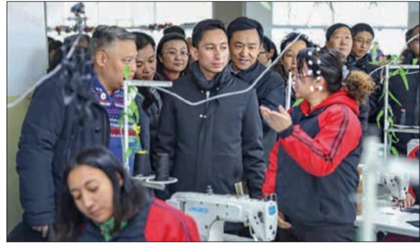
المبعوثون الدبلوماسيون يطلعون على آلية العمل في أحد المصانع