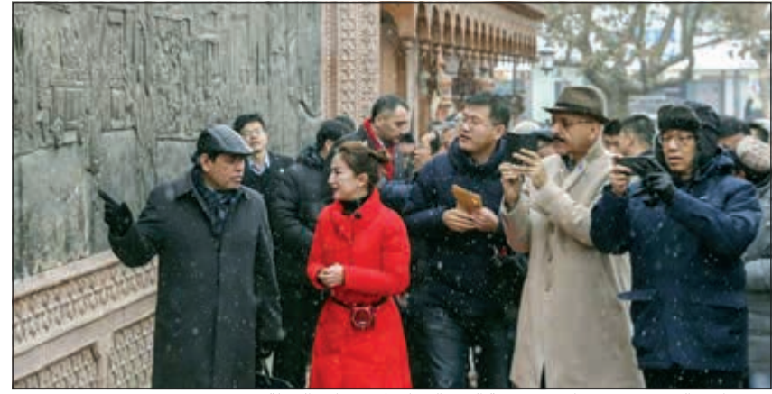
سفيرنا في الصين سميح حيات في مقدمة الوفد الدبلوماسي خلال الجولة