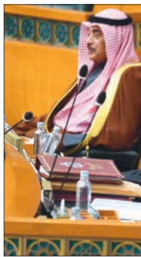
الشيخ صباح الخالد والشيخ خالد الجراح ود.فهد العفاسي وراكن النصف