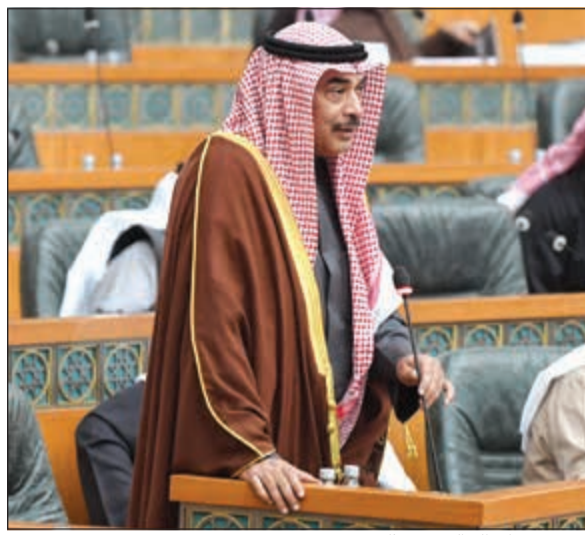
الشيخ صباح الخالد متحدثاً