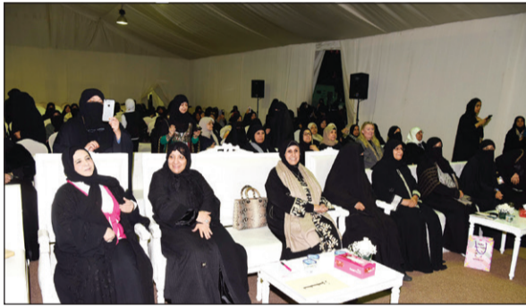
الشيخة أورد الجابر في مقدمة الحضور

الجسم والعقل ويجعل الأسرة الكويتية نسيجاً متكاملًا من حيث القيم والمفاهيم مع تأكيد الهوية الإسلامية المتميزة النابعة من ديننا الإسلامي.