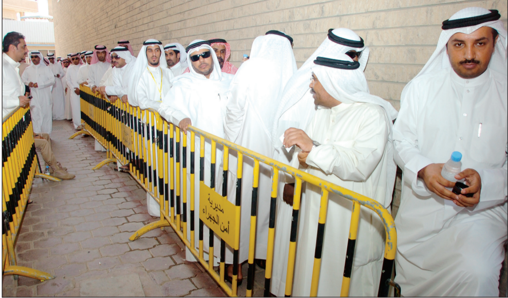
انتخابات سابقة بنادي الجهراء

للرياضة أن الحلول أضحت - بحسب رؤية قانونية للأمر - تكمن في خيارين لا ثالث لهما، الأول يتمثل في الدعوة لجمعية عمومية غير عادية لإقرار عودة الـ 900 المشطوبين أو تخويل اللجنة الانتخابية المشكلة باتخاذ ما تراه مناسباً بهذه القضية، مع العلم بأن العدد المطلوب لعقد جمعية عمومية غير عادية بالنادي تتطلب حضور 500 عضو، والحل الآخر يتمثل في مخاطبة اللجنة الأولمبية الكويتية لتأجيل الانتخابات بنادي الجهراء والدعوة لعقد جمعية عمومية لحين الانتهاء من البت وبشكل قاطع في إعادة تسجيلهم من عدمه، لاسيما أنه حتى اللحظة لا توجد هيئة قضائية رياضية كويتية لحسم الخلاف الرياضي.