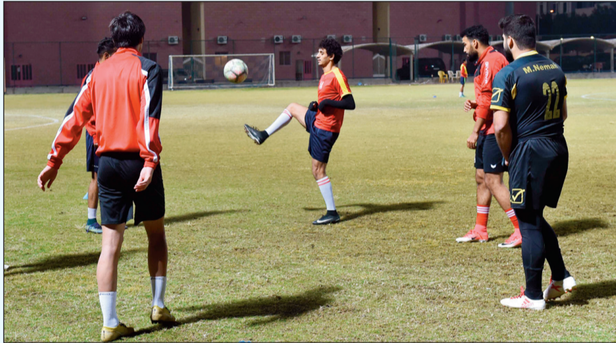
لاعبو خيطان في التدريبات الأخيرة