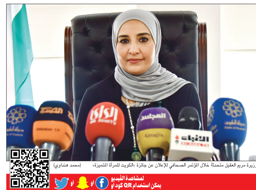
الوزيرة مريم العقيل ممثلة خلال المؤتمر الصحفي للإعلان عن جائزة «الكويت للمرأة المتميزة» (محمد هنداري)