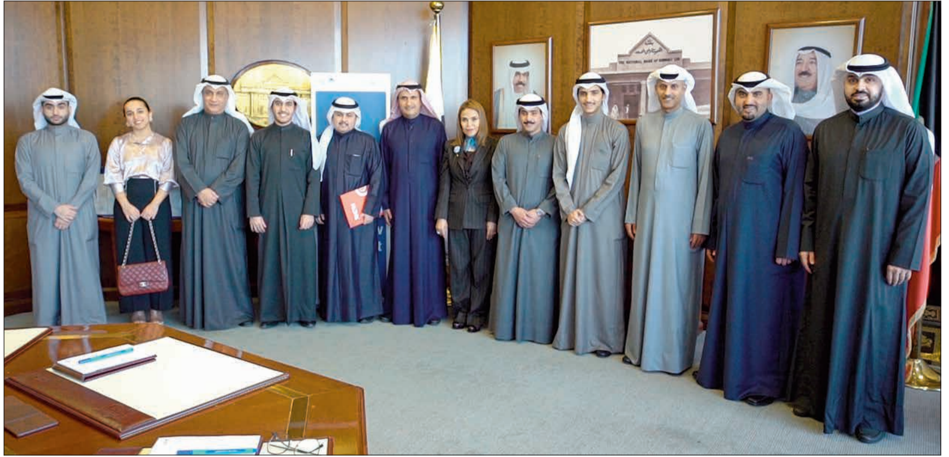
الإدارة التنفيذية للبنك في لقطة تذكارية مع الاتحاد الوطني لطلبة الكويت بأميركا

«تطوير سوق المال من خلال المبادرات الإقليمية» سيناقتش أهم الحوافز والمبادرات المشجعة للإدراج