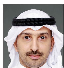
عبد الوهاب الباطين

المشاركة في التصويت على المسائل المتعلقة بالسؤال والاستجواب وطرح موضوع عام للمناقشة أو في أي اختصاص رقابي آخر». المادة الثانية على رئيس مجلس الوزراء والوزراء - كل فيما يخصه - تنفيذ هذا القانون. ونصت المذكرة الإيضاحية للاقتراح بقانون بتعديل المادة 1 من القانون رقم 12 لسنة 1963 في شأن