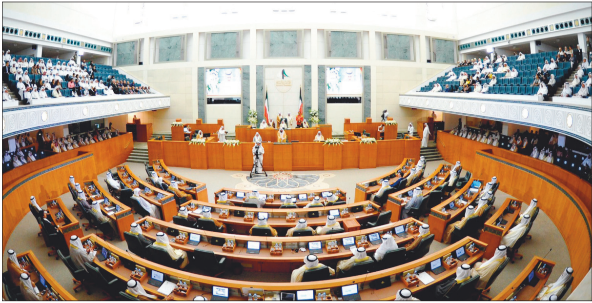
صورة ارشيفية لمجلس الأمة

أصدر 13 نائبا بيانا صحافيا بشأن حكم المحكمة الدستورية في تفسير المادة 16 من اللائحة الداخلية لمجلس الأمة، ونص البيان على ما يلي: اطلعنا بقلق بالغ على حكم المحكمة الدستورية المؤرخ في 19 ديسمبر 2018 والقاضي بعدم دستورية المادة (16) من اللائحة الداخلية الصادرة عام 1963، وعلى الرغم من إيماننا بصيانة واستقلالية القضاء وحماية نزاهة القضاة وحيادهم - صدر الحكم ليخل بالتوازن الدستوري ما بين السلطات العامة للدولة من جانب وينتقص من استقلال السلطة التشريعية من جانب آخر.