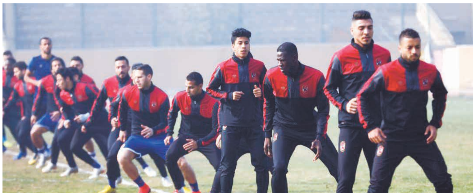
الجدي شاعر الأهلي في تدريباته استعدادا لبراميدز