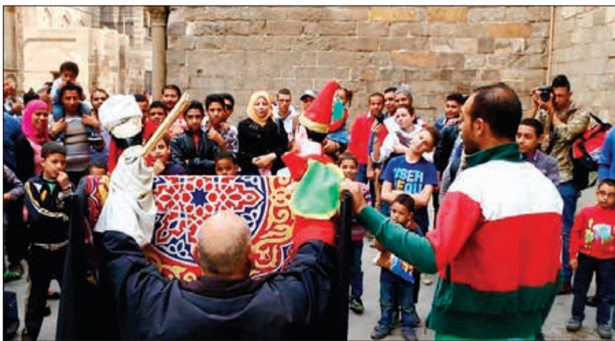
.. بجانب من عرض الأراجوز في أحد شوارع القاهرة