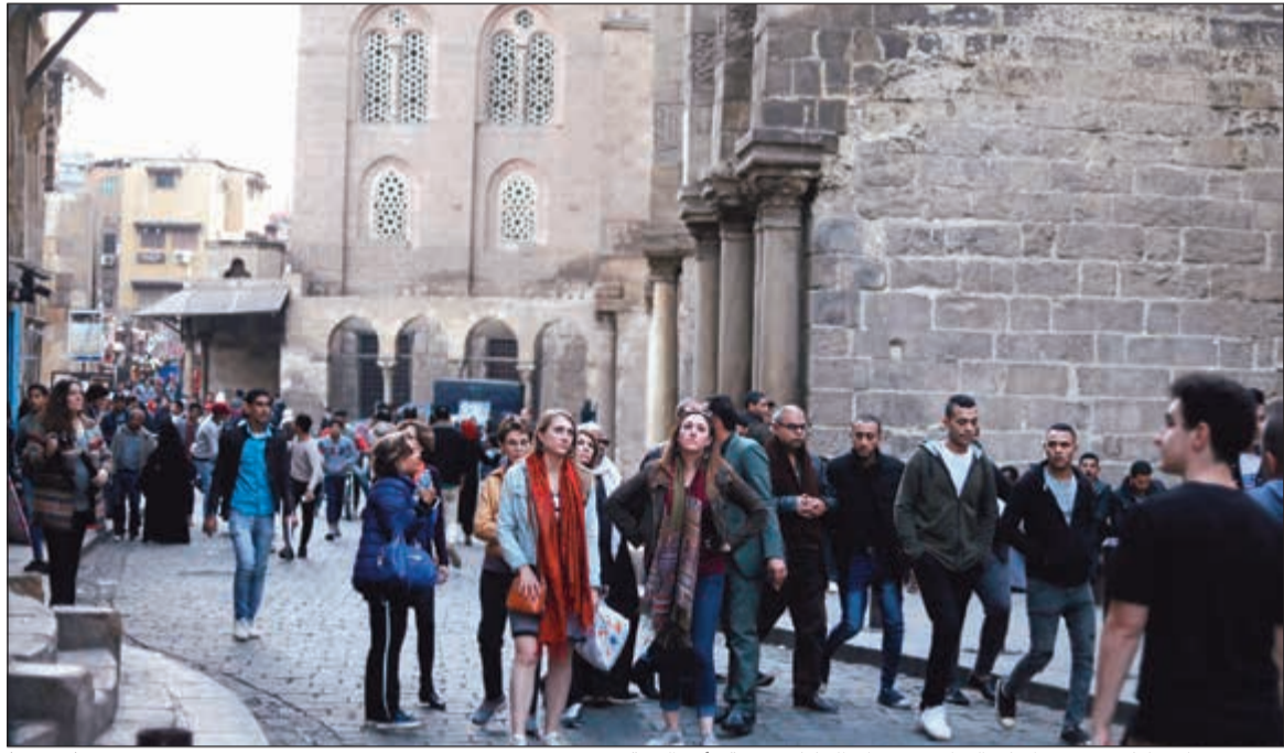
حضور سياحي كثيف حرصوا على التواجد في خان الخليلى عشية رأس السنة

التفاصيل كاملة على موقع «الأنباء» الإلكتروني: www.alanba.com.kw