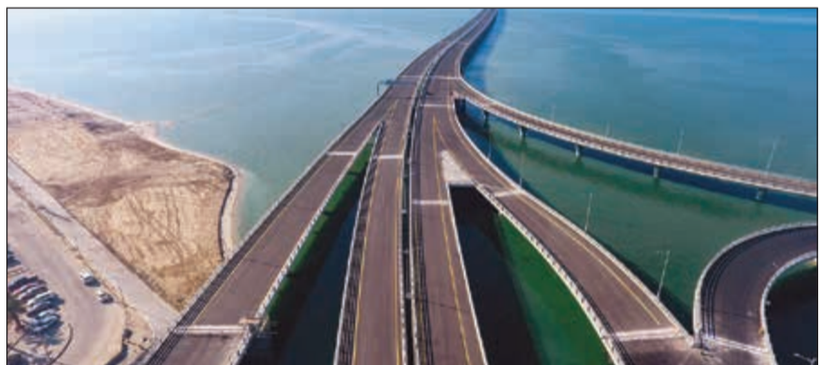
جسر الشيخ جابر (وصلة الدوحة)

ربط منطقة الدوحة بمنطقة الشويخ من بداية جسر الغزالي وجسر الشيخ جابر، وذلك لتخفيف الازدحام المروري واستكمالاً لمنظومة الطرق في البلاد. وأضافت اشكناكي ان الجزء البري الذي افتتح ويبلغ طوله 4,7 كيلومترات بخدم معسكراً تابعاً للجيش ومنطقة الدوحة أيضاً، متوقعة افتتاح جسر جابر في فبراير المقبل تزامناً مع الأعياد الوطنية. التفاصيل ص6