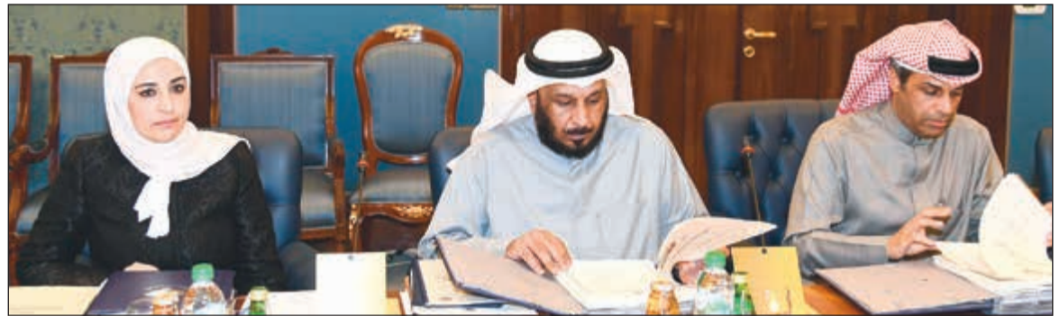
الوزراء د. خالد الفاضل وسعد الكرخان ودمريم العقيل وفهد الشعللة أثناء حضورهم الاجتماع الأسبوعي لمجلس الوزراء أمس

مصادر خاصة لـ «الأنباء»: مجلس الأمة يعلن خلو مقعد النائب بحسب نص المادة 84 من الدستور