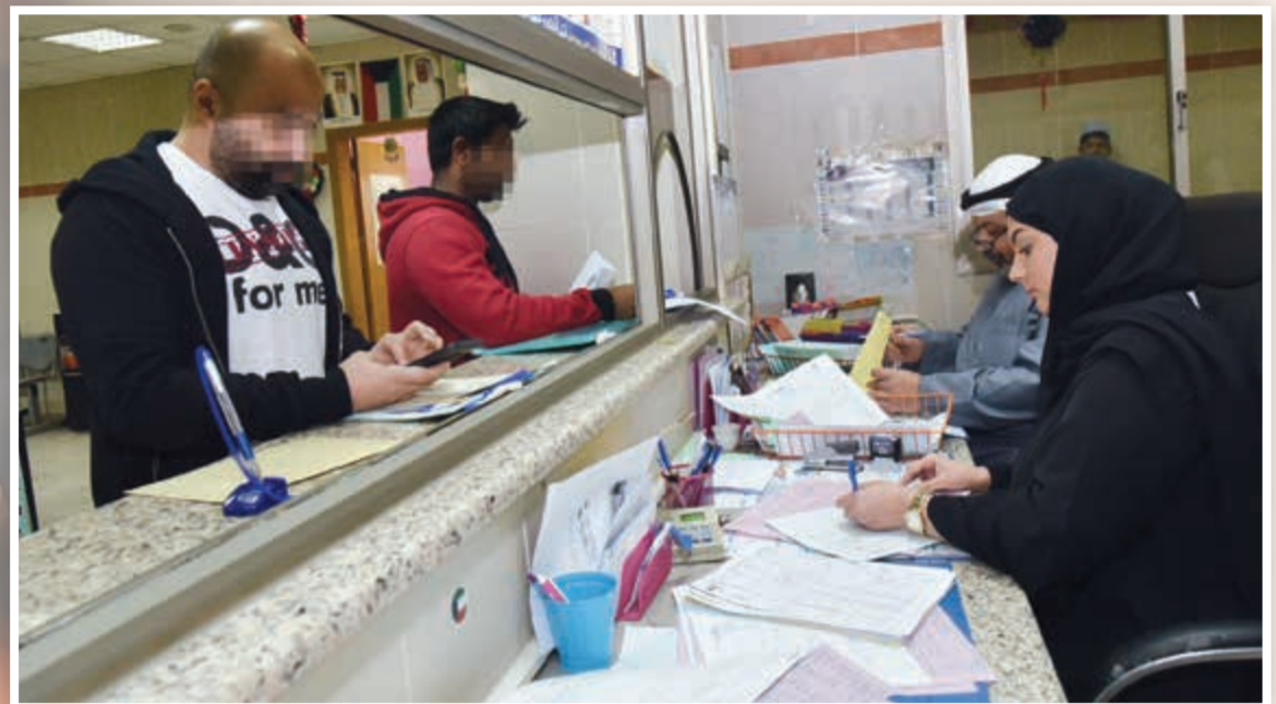
جانبا من تسليم الشهادات