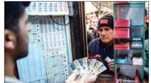
تركي يشتري تذاكر اليانصيب