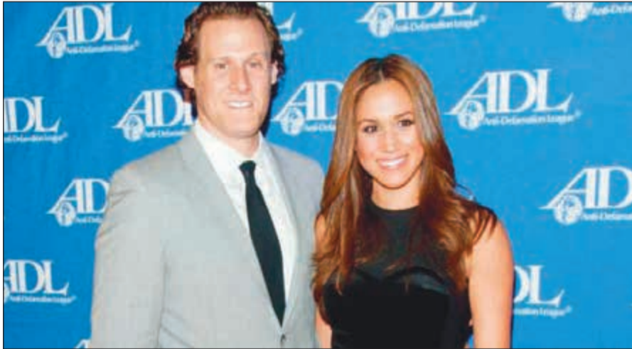
ميغان ميركل وزوجها الأول

حاليا من خلاف مع زوجة الأمير ويليام، كيت ميدلتون بعد أن اتهمت الأخيرة بالفظاظة في التعامل مع موظفي القصر الملكي.