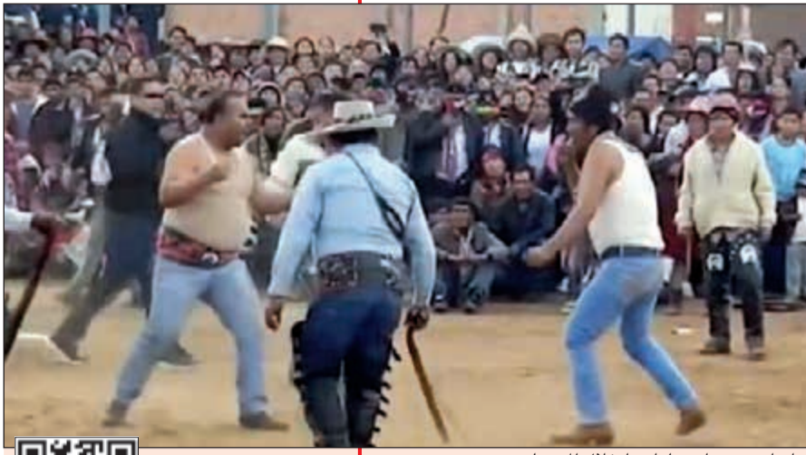
متباريان بحسمان نزاعتهما خلال المهرجان