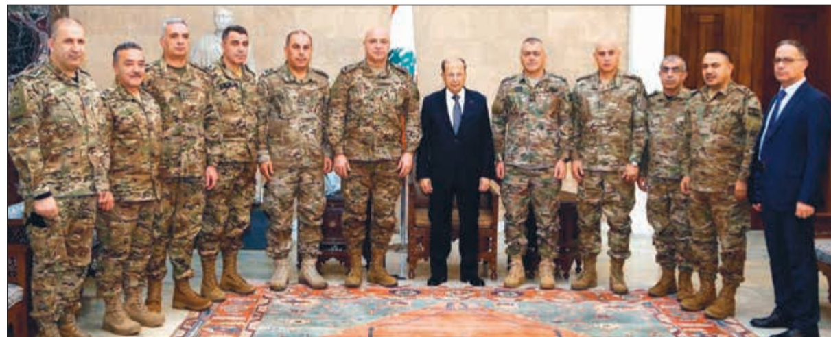
الرئيس العماد ميشال عون مستقبلاً قائد الجيش العماد جوزف عون على رأس وفد من كبار ضباط القيادة لتقديم التهنئة بالأعياد

بيروت - عمر حنجر الأجواء الإقليمية المحيطة بلبنان التي انقشاع أفضل، نسبة عالية من التفاهات بدأت تترجم على صفحة المتصارعين على الحلبة السورية، حيث موقد الأزمة ومحور الحلول. ومن علامات الفرج الانسحاب الأميركي من شمال سورية، وزيارة الرئيس دونالد ترامب الخاطفة إلى العراق، وملاطفة الرئيس التركي رجب طيب أردوغان للرئيس الأميركي وزيارة الرئيس السوداني عمر البشير إلى دمشق بطائرة روسية وإعادة الإمارات العربية المتحدة فتح سفارتها في دمشق، في حين تبدو عواصم عربية أخرى على الخط.