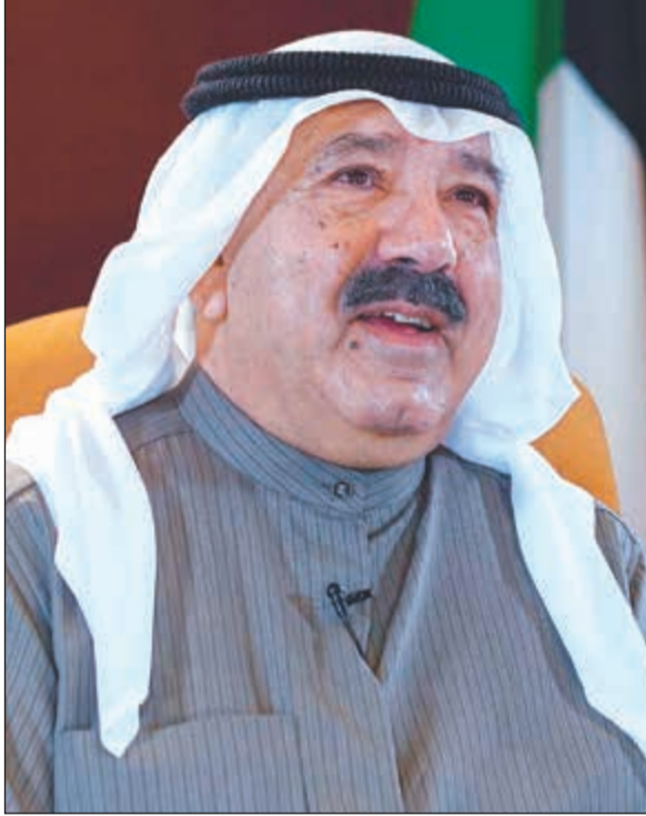
الشيخ ناصر صباح الأحمد