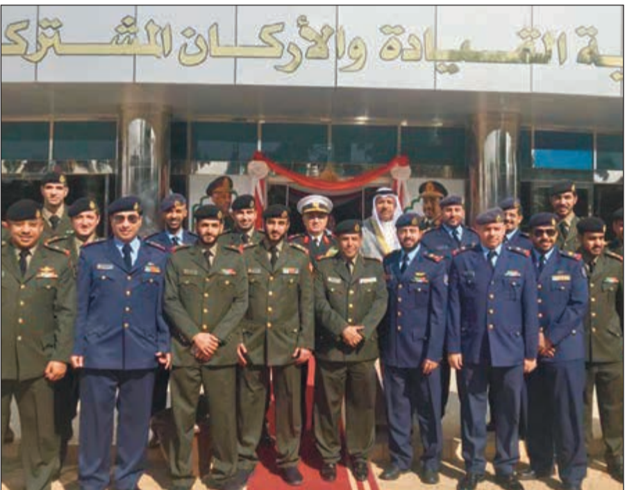
مدير الكلية وسفيرنا في السودان والملحق العسكري مع الضباط الكويتيين

الخرطوم - (كونا): أشاد الرئيس السوداني عمر البشير بالعلاقات المتطورة مع الكويت، معربا عن أمه في أن تشهد المزيد من التقدم والتطور في ميادين التعاون المشترك كافة. جاء ذلك خلال احتفالية أقامتها كلية القادة والأركان التابعة لوزارة الدفاع السودانية بمناسبة تخريج الدفعة 45 والتي ضمت 54 من الطلبة الضباط الكويتيين. واعتبر الرئيس السوداني ان تخريج ضباط من الكويت و9 دول أخرى يصب في مصلحة الأمة وقضاياها ويؤكد وحدة المصير والهدف. وقال إن هناك العديد من المخاطر والتحديات التي تتعرض لها البلدان العربية والإسلامية وأشكالا مختلفة لحاولات الإبتزاز الاقتصادي والسياسي من الدول الكبرى لفرض التبعية على الشعوب. من جانبه، قال مدير كلية مبارك عبداللله للقادة والأركان المشتركة اللواء