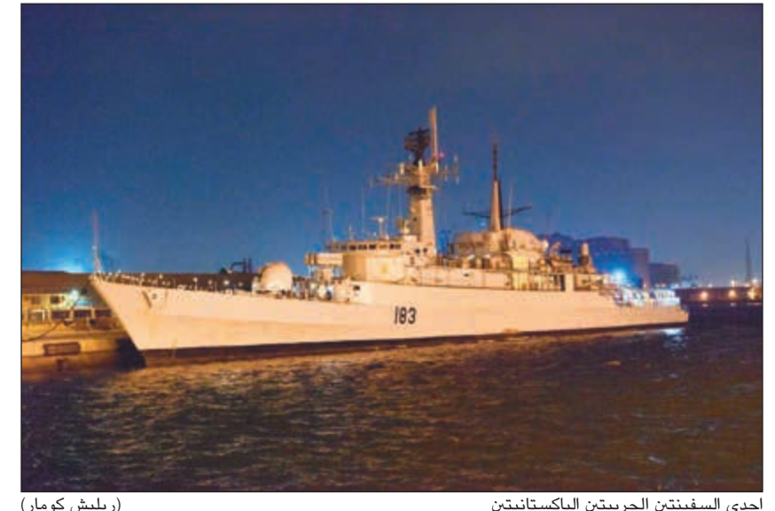
أحد السفينتين الحربيتين الباكستانيتين (ريليش كومار)