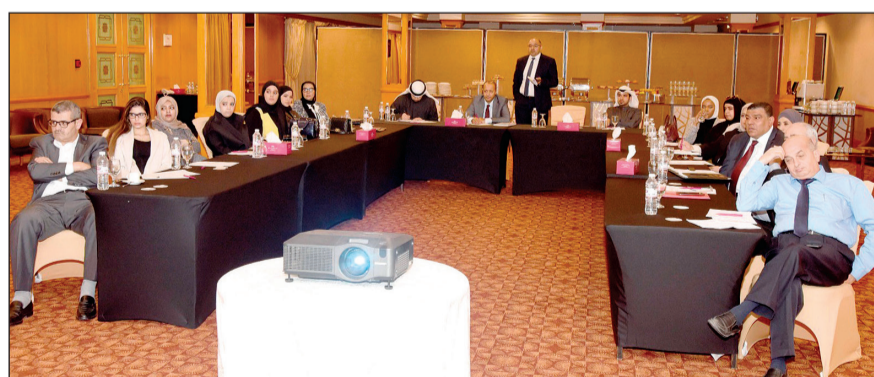
حضور ورشة العمل