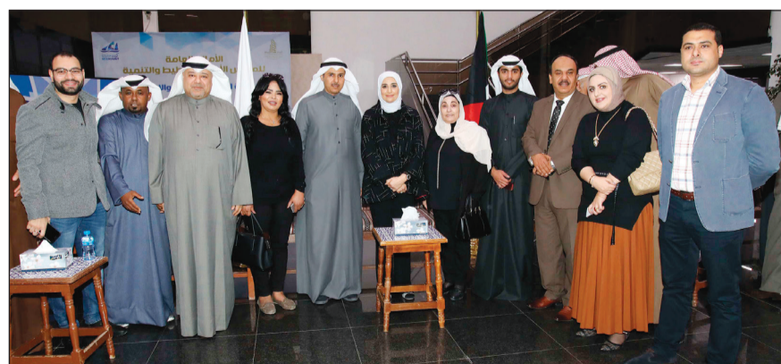
الوزيرة مريم العقييل مع ممثلي وسائل الإعلام

دمج هيئة العمل والهيكله جاء بناء على دراسات متأنية تستخدم نتائجها سوق العمل