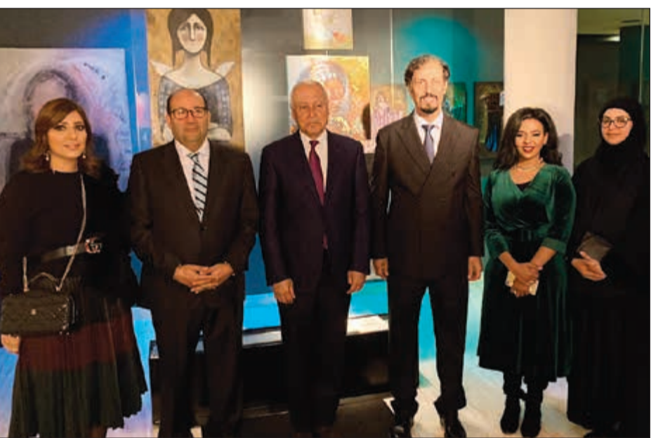
الشيخ علي الخالد وأحمد أبو الغيث والسفير هشام بدر والفنانات المشاركات