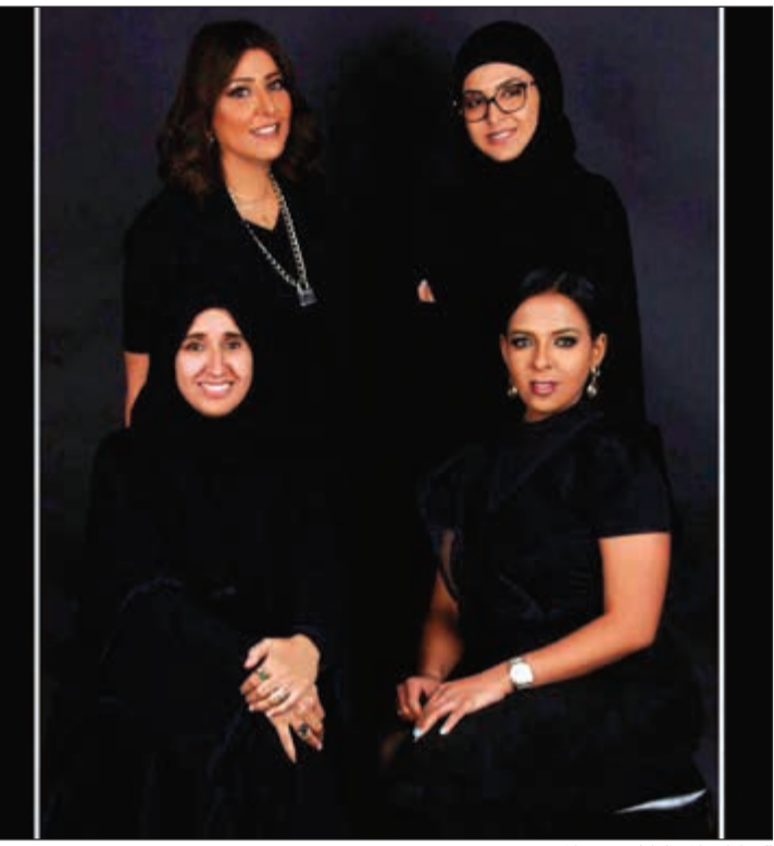
الفنانات المشاركات في المعرض