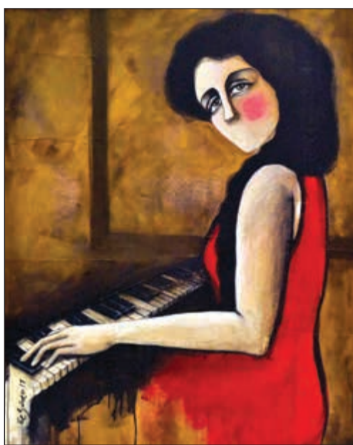
أحدى اللوحات المشاركة