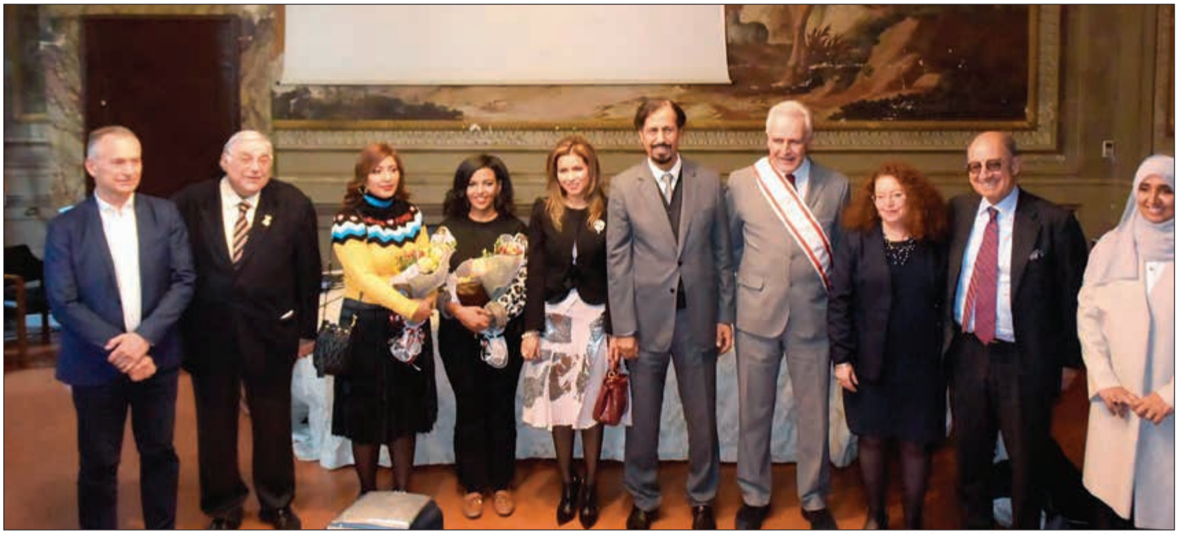
السفير علي الخالد وحرمه دسارة الركيان مع الفنانين وبعض الحضور