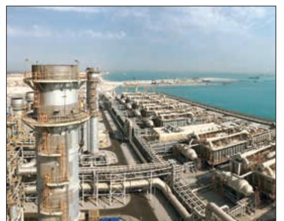
محطة الزور الشمالية الأولى

أعلنت شركة شمال الزور الأولى لبناء وتنفيذ وتشغيل وإدارة وصيانة محطة الزور الشمالية المرحلة الأولى في بيان صحافي أمس عن بلوغ محطة الزور الشمالية الأولى عامها الثاني من التشغيل التجاري بنجاح وسلامة، وهي أول محطة مستقلة لتوليد الطاقة وتلبية المياه في الكويت تسهم اليوم بطاقة إنتاجية تصل إلى 1,539 ميغاواط من