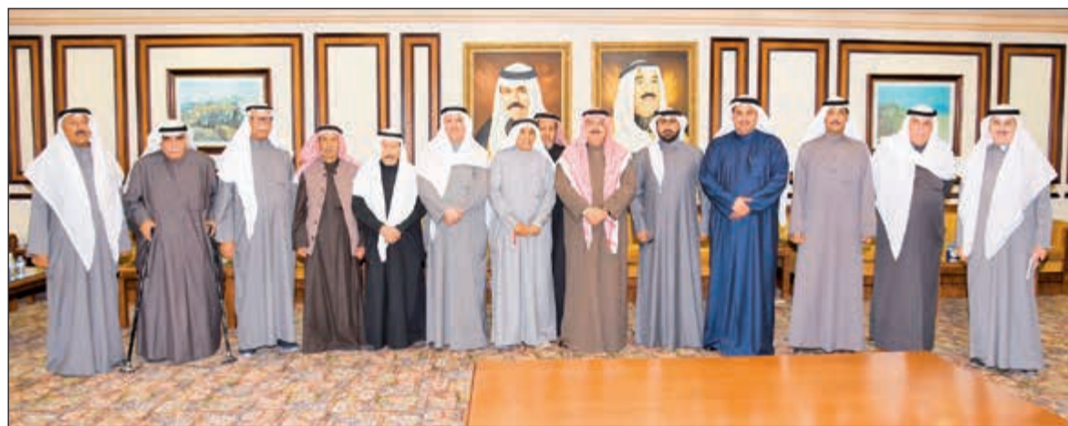
الفريق م. ثابت المهنا مستقبلاً عددا من مختاري مناطق محافظة العاصمة

من الممكن التعاون والتنسيق مع أي طرف يساعد في خدمة المنطقة وإبناؤها. وختم المحافظ كلامه بأن المختارين يتحملون مسؤولية عملهم على متابعة كل ما تحتاجه المناطق من مدارس ومستوصفات ومخاضر أمنية ومختلف المتطلبات التي يحتاجونها شاكراً في الوقت ذاته الجهود التي يقوم بها المختارون في خدمة أبناء مناطقهم.