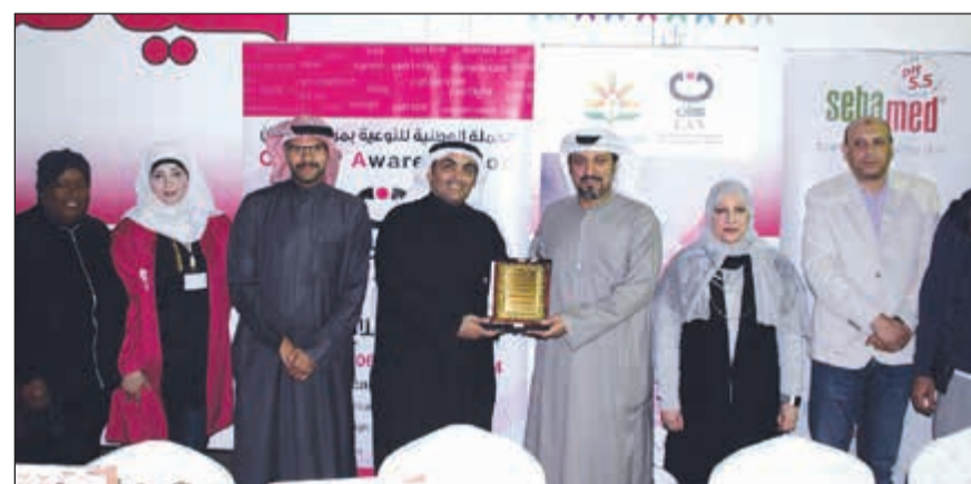
تكريم جمعية الفيحاء التعاونية

مؤكداً أنه لا صحة لكل هذه الأقاويل، داعياً الجمهور إلى ضرورة استقاء المعلومات من المختصين حتى لا يقعوا فريسة مثل هذه الشائعات التي قد تدمر حياة إنسان. وأوضح الصالح أنه انطلاقاً من المسؤولية الملقاة على عاتق حملة (كان) حرصت على فتح باب التواصل مع الجمهور عبر مختلف الوسائل، حيث تستقبل الحملة استفسارات الجمهور حول الأمراض السرطانية من خلال المعارض