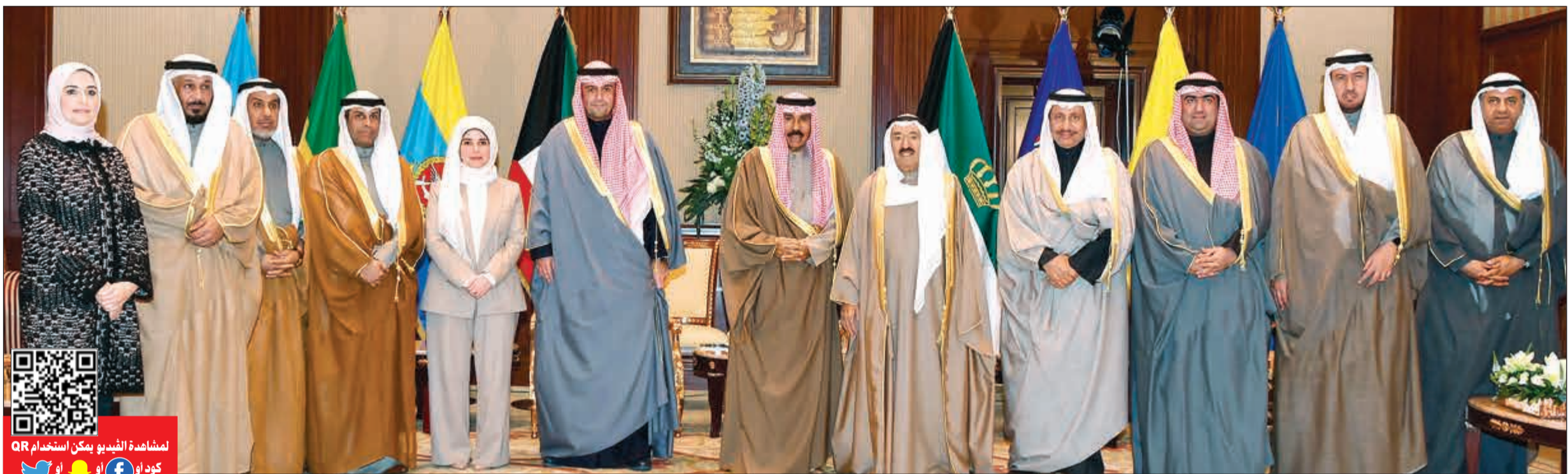
صاحب السمو الأمير الشيخ صباح الأحمد وسمو ولي العهد الشيخ نواف الأحمد وسمو رئيس الوزراء وأنس الصالح مع الوزراء

المبارك: سنلتفت لكثير من المشاريع في البلاد وسنطبق رؤية سموكم لمستقبل الكويت وسنضع مصالحها نصب أعيننا