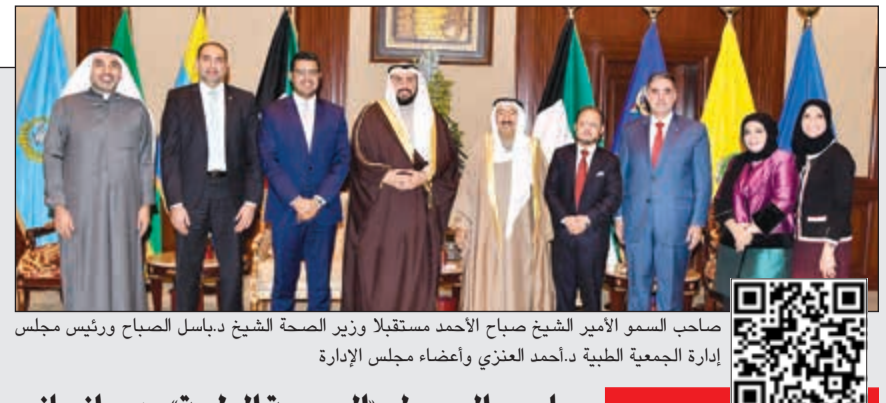
صاحب السمو الأمير الشيخ صباح الأحمد مستقبلاً وزير الصحة الشيخ دباسل الصباح ورئيس مجلس إدارة الجمعية الطبية د. أحمد العذري وأعضاء مجلس الإدارة

صاحب السمو لـ «الجمعية الطبية»: دور إنساني