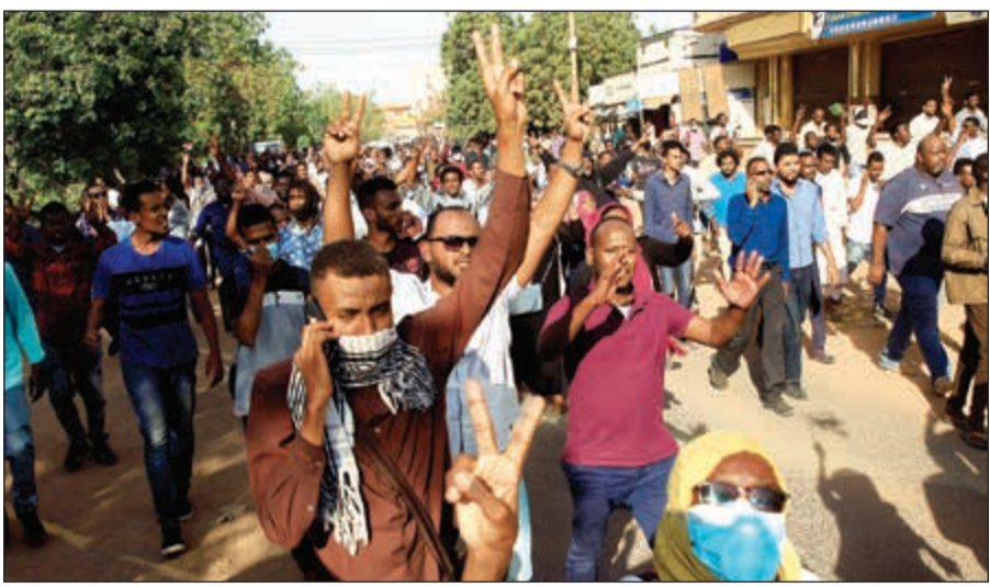
محتجون سودانيون يهتفون ضد النظام في الخرطوم (رويترز)

عواصم - وكالات: لم تفلح وعود الرئيس السوداني عمر البشير «الإصلاحية» في إقناع الآلاف بعدم المشاركة في المظاهرات والوصول إلى أبواب القصر الرئاسي قبل أن تفرقهم قوات الأمن، داعين البشير للالتحق، فقال لهم الاتهامات بالخيانة. ومن ولاية الجزيرة وسط البلاد، اعتبر البشير أن الجماهير التي حضرت لاستقباله، دليل واضح على أن الشعب مع التعمير والبناء والتنمية. وأضاف أن «من يخرب المؤسسات ويحرقها عملاء وخونة ومرترقة». وقال متحديا «لا ننحني لأحد، ومن يمد يده نقطعها له، ومن يمد عينه نفاقه له». من جهتها، أفادت منظمة العفو الدولية بأن هناك تقارير موثوقة تؤكد مقتل 37 محتجا برصاص قوات الأمن السودانية خلال خمسة أيام من الاحتجاجات. • التفاصيل من 24