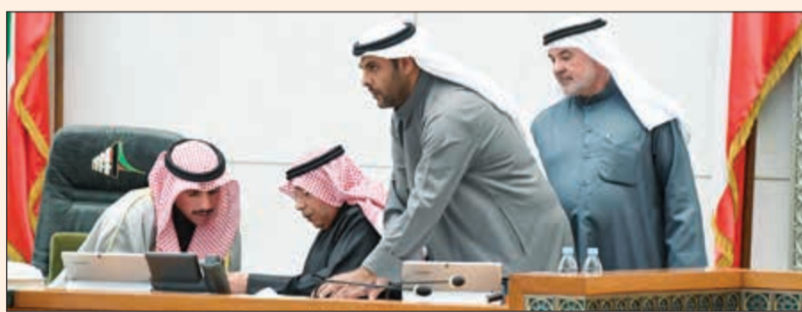
رئيس مجلس الأمة مرزوق الغانم على المنصة وجواره الشيخ خالد الجراح ويوسف الفضالة وصالح عاشور (ماني الشمري)

أكد نائب رئيس مجلس الوزراء ووزير الخارجية الشيخ صباح الخالد أن ما تم إنجازه من الحكومة خلال السنوات السبع الماضية عمل جبار تجاه العمل الخيري في الكويت، لافتا إلى أن هذا الموضوع حساس ومهم حيث كانت التهم تتكاثف للكويت جزافا، وأوضح الخالد في مداخلة له بمجلس الأمة أمس، أن الحكومة استطاعت حماية العمل الخيري عن طريق تنظيمه عبر الربط الآلي بين الجمعيات الخيرية ووزارات الخارجية والشؤون الاجتماعية والداخلية والقيام بمسؤولياتها في الحفاظ على سمعة العمل الخيري الكويتي.