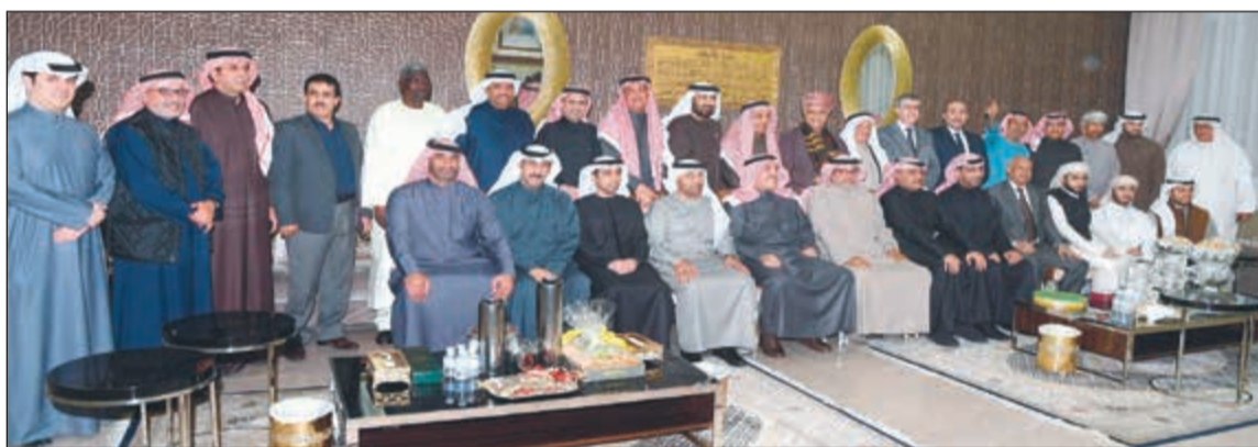
السفير الإماراتي رحمة الزعابي متوسلا الحضور خلال حفل العشاء