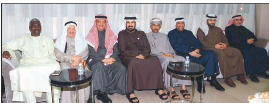
الزعابي وعدد من الحضور

أعلن السفير الإماراتي لدى الكويت رحمة الزعابي أنه «لا توجد حتى الآن بوادر لحل الأزمة الخليجية»، مشيدا بالعلاقات الإماراتية - الكويتية التي وصفها بالقوية والعميقة.