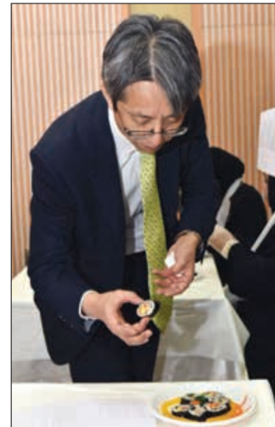
السفير الكوري يتذوق أحد الأطباق

انطلقت مساء أول من أمس فعاليات «الأسبوع الثقافي الكوري» في الكويت بمهرجان أطعمة الشارع الكوري في مبنى السفارة بالمنطقة الدبلوماسية في مشرف. وأكد سفير كوريا الجنوبية هونغ يونغ جي أن السفارة تحتضن الفعالية كل عام وتتضمن مسابقة لطهي الطعام الكوري الشعبي بمشاركة كبيرة من طلبة المدارس والجامعات من الكويتيين والمقيمين الذين يتضاعف عددهم عاما بعد عام، موضحا أنهم سينظمون يوم غد الأربعاء أمسية الفيلم الكوري في سينما سكيب بالساحة في تمام الساعة 6 مساء، وتليها يوم الخميس مسابقة الأغاني الكورية المقررة في تمام الساعة 6 مساء بمعنى السفارة بمشاركة الكثير من الشباب الكويتي الذين أصبح بعضهم يتقن الغناء باللغة الكورية. وأضاف أن مثل هذه الفعاليات تعمل على تقريب شعبي البلدين بشكل كبير، لافتا إلى أن الديوانية الكورية الكويتية قامت بالعديد من الفعاليات التي ساهمت في هذا الأمر، مبديا إعجابه الشديد بما لاحظته من إقبال