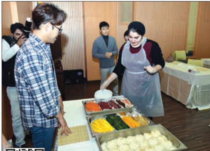
جانبا من المكولات الشعبية الكورية (محمد هندواوي)