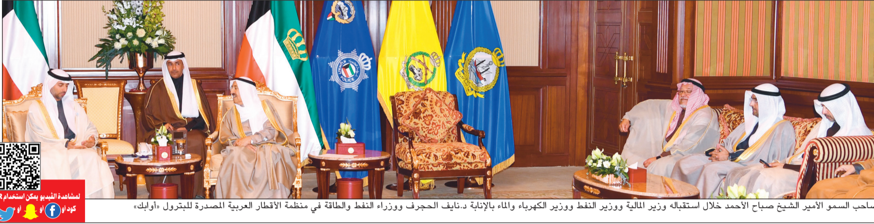
صاحب السمو الأمير الشيخ صباح الأحمد خلال استقباله وزير المالية ووزير النفط ووزير الكهرباء والماء بالإتباع د.نايف الجحرف ووزراء النفط والطاقة في منظمة الأقطار العربية المصدرة للبترول «أوابك»

■ وزير النفط العراقي: دراسة اتفاقية تصدير الغاز إلى الكويت في اللمسات الأخيرة