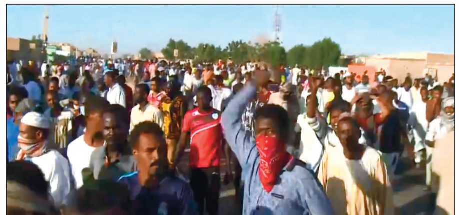
جانب من الاحتجاجات التي يشهدها السودان

أصدرت السفارة البريطانية في الكويت بياناً أكدت فيه أنه يمكن للراغبين في السفر من وإلى المملكة المتحدة استخدام التأشيرة الصالحة في جواز السفر المنتهي صلاحيته دون الحاجة إلى نقلها إلى الجواز الجديد لكنها شددت على ضرورة أن يصطحب المسافر كلا الجوازين معه. جواز السفر القديم المنتهي صلاحيته والذي يحتوي على التأشيرة الصالحة مع جواز السفر الجديد، وأضاف البيان أنه لا يمكن للمسافر استخدام تأشيرة صالحة في جواز السفر المنتهي الصالحة لإثبات أن لديه الحق في العمل بالمملكة المتحدة إلا أنه يجب عليه استبدال التأشيرة الخاصة به بتصريح الإقامة البيومتري.