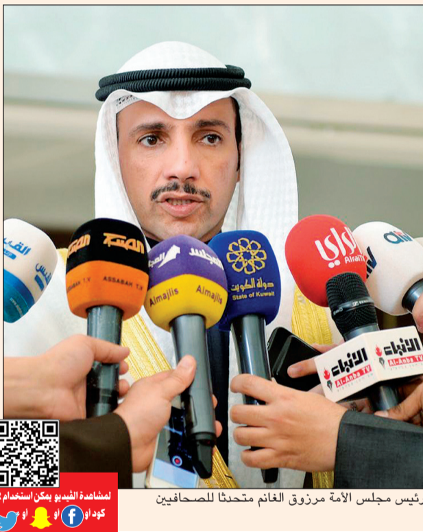
رئيس مجلس الأمة مرزوق الغانم متحدثاً للصحافيين