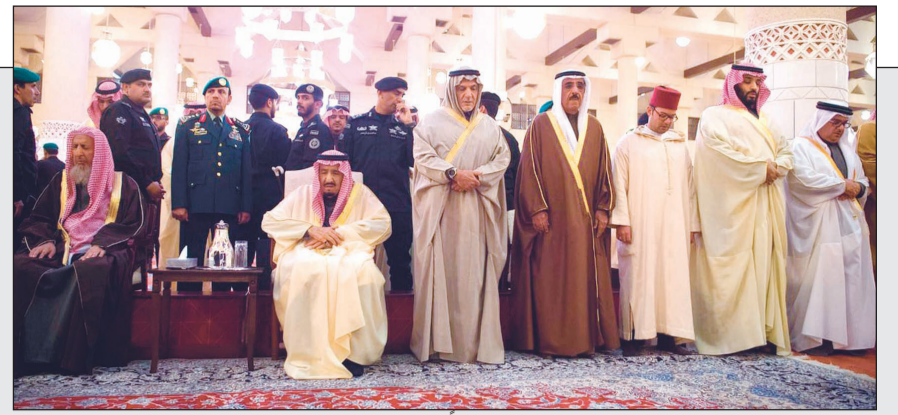
خادم الحرمين الشريفين الملك سلمان بن عبدالعزيز مؤدياً صلاة الميت على الأمير طلال بن عبدالعزيز أمس

خادم الحرمين الشريفين يؤدي صلاة الميت على الأمير طلال بن عبدالعزيز 26