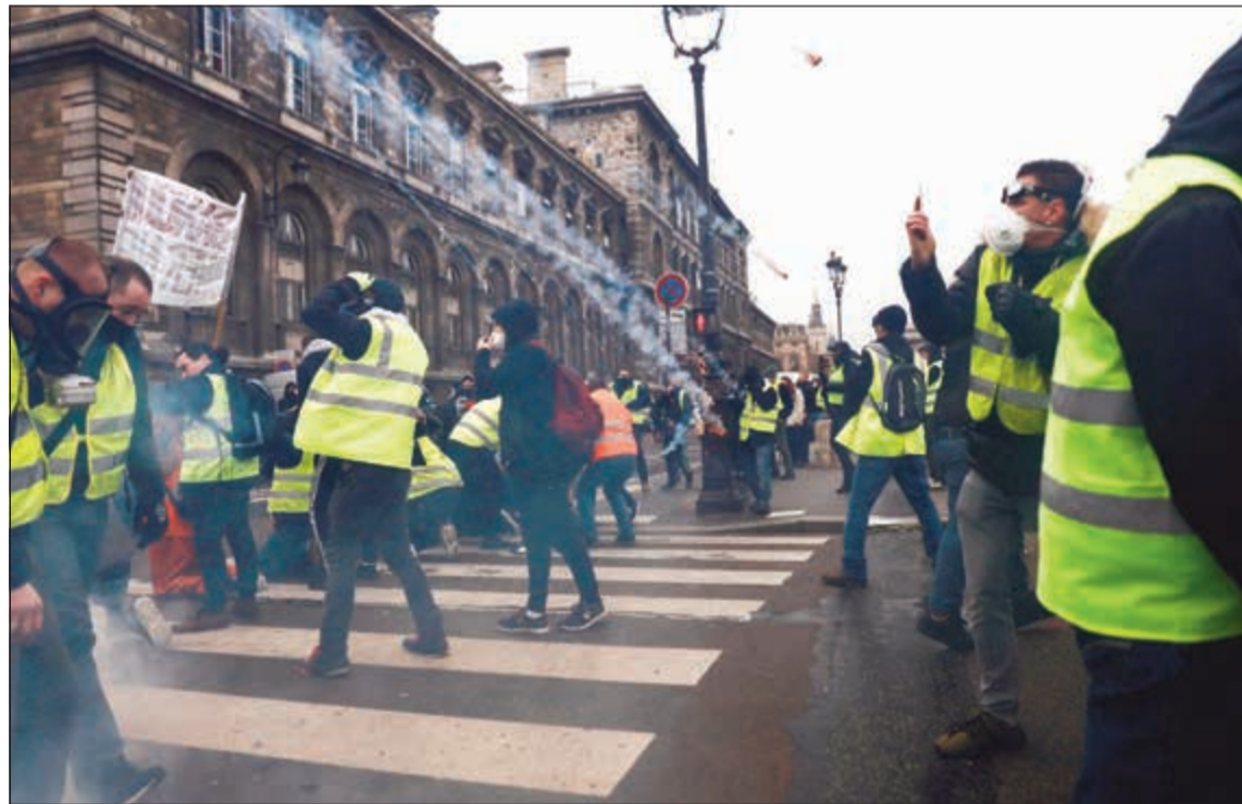
متظاهرو «السترات الصفراء» يواجهون قنابل الغاز المسيل للدموع خلال احتجاجات في باريس أمس

تجمع عشرات أمام قصر فرساي ونحو ألف محتج فقط في باريس تحرك باهت لاحتجاجات «السترات الصفراء» في أسبوعها السادس