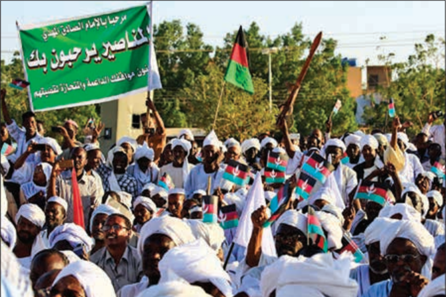
أنصار الصادق المهدي يرحبون بعودته من المنفى الاختياري