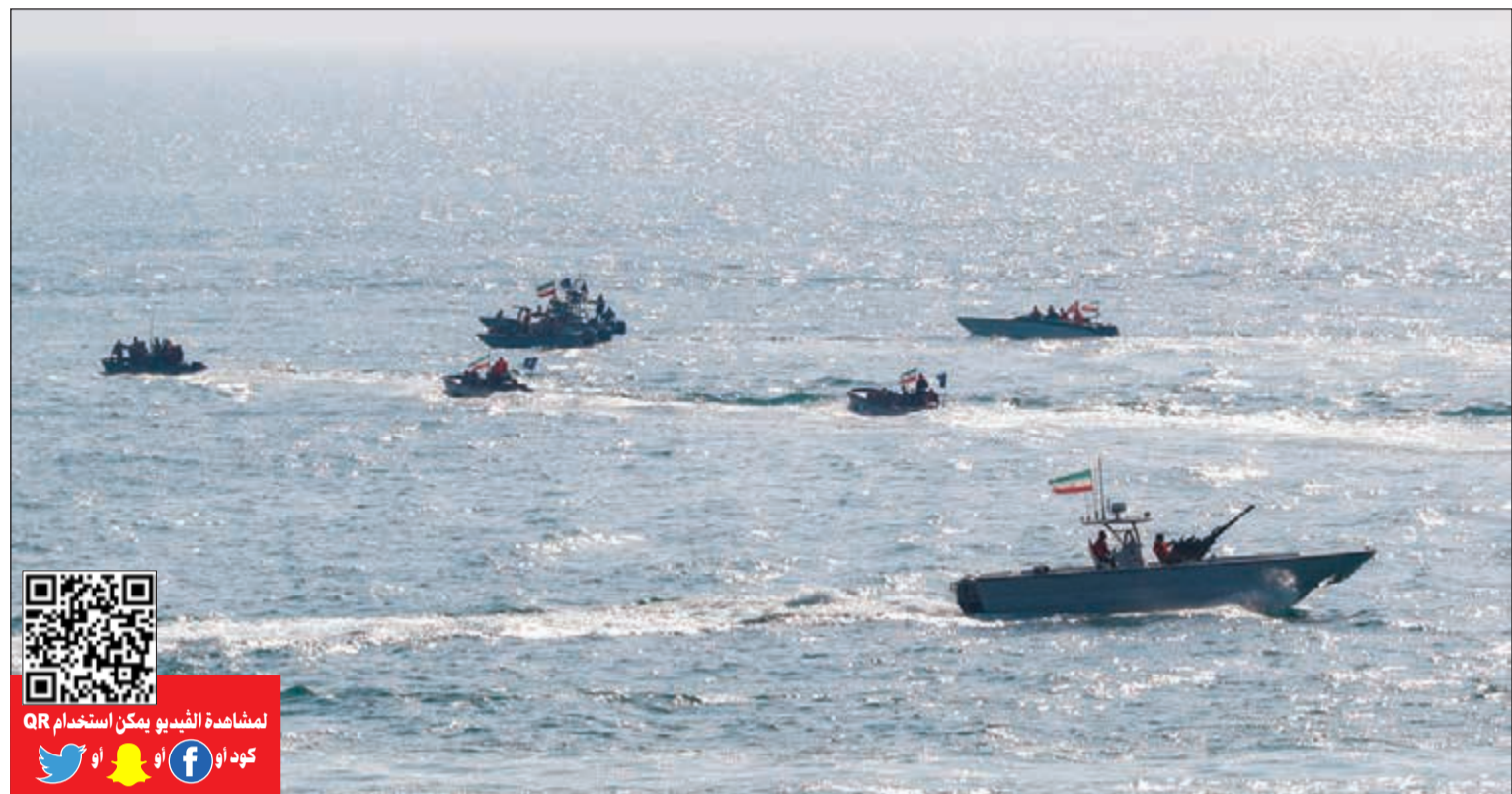
زوارق الحرس الثوري شاركت في المناورات أمس

من جانبه، علق قائد الحرس الثوري محمد علي جعفري على المناورات، بأنها كانت «رداً على ادعاءات العدو تجاه إيران»، وأضاف: «على العدو أن يعلم أن قدرات إيران الدفاعية هي قدرات رادعة»، مؤكداً أن بلاده «سترد الصاع بعشرة أضعافه على أي عدوان». وشملت المناورات التي اختتمت أمس، تدريبات على «احتلال مواقع اقتصادية استراتيجية للعدو المغترض» والسيطرة على ميناء ورسيف بحري في الخليج. كما جرى التدريب على إسقاط مروحيات معادية باستخدام الغام بحرية «طائرة»، وهي الغام يمكن التحكم بها عن بعد حيث تقفز لتنفجر على مسافة من 150 إلى 180 متراً، ويمكن لشظاياها أن تلحق الضرر بمروحيات العدو على بعد 50 متراً.