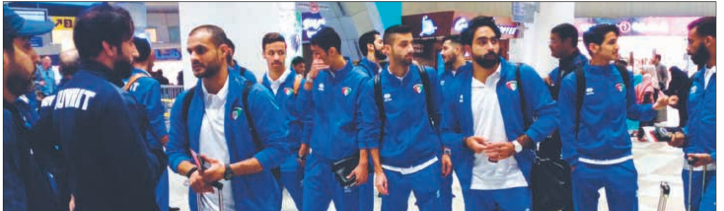
لاعب المنتخب الوطني في المطار قبيل مغادرتهم الى دبي أمس

هذا المجال، حيث أبرمت عقوداً مع منتخبات عالمية عديدة شاركت في منافسات بطولة كأس العالم 2018 بروسيا. كما تعاقد الاتحاد مع شركة FIELD WIZ المتخصصة في تقنية التحليل البدني ومتابعة العناصر البدنية للاعبين، حيث قامت الشركة بتوفير تقنية برنامج GPS للمنتخبين الأول والأولمبي.