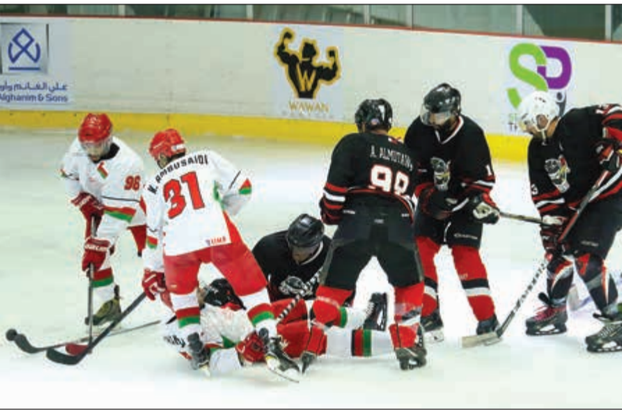
جانب من إحدى المباريات

ولفت الى انني أشعر بالرضا لأداء اللاعبين والروح العالية التي أبدوها خلال المباريات والالتزام في التدريبات والواجبات المنوطة بهم، لكن مع ذلك هناك بعض الأمور لابد من إعادة تقييمها خلال فترة التوقف المقبلة وفق منهج إعادة ترتيب الحسابات ليستعيد الأخضر عافيتها قبل انطلاق الجولات المتبقية لبطولة الدوري.