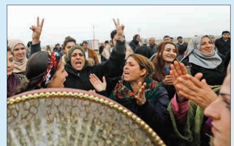
أكراد يتظاهرون ضد تركيا قرب الحدود في بلدة رأس العين

الأكراد يشعرون بأنهم تلقوا طعنة من الحليف الأميركي ويلجأون إلى الاستعانة بالنظام السوري: الانسحاب ينعش «داعش» تركيا المستفيد المباشر والأول ويفتح لها باب الدخول إلى شرق الفرات إيران قلقة من إعادة فتح مسألة سحب قواتها في سياق التنسوية تراب: الفرار لم يكن مفاجئاً وأميركا لا تريد أن تكون شرطي الشرق الأوسط الانسحاب من سورية يجب مشروعاً أميركياً لـ دعم ضم الجولان 19