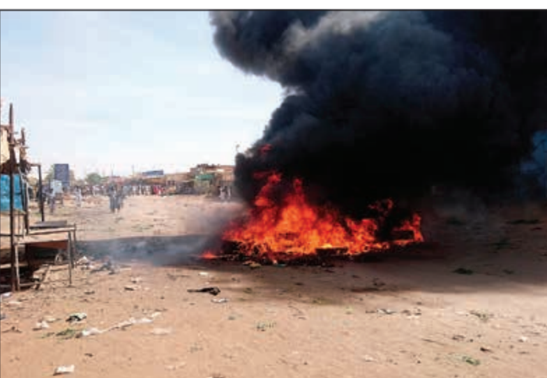
نيران مشتعلة في شوارع عبيدة خلال تجدد التظاهرات احتجاجاً على غلاء الاسعار أمس (رويترز)

رفع بنك الكويت المركزي سعر إعادة الشراء - الريبو ربع نقطة، حيث بلغ الليلة واحدة 2,50٪، كما رفع الريبو لمدة أسبوع من 2,50٪ إلى 2,75٪، ولمدة شهر من 3٪ إلى 3,25٪. وجاءت قرارات «المركزي» الكويتي عقب تثبيت الفائدة عند 3٪ مساء أول من أمس، مخالفاً رفع الفائدة الأميركية بربع نقطة مئوية، إلى نطاق 2,25 - 2,5٪، للمرة الرابعة خلال 2018. وقال محافظ بنك الكويت المركزي د.محمد الهاشل إن القرار يهدف لترسيخ الأجواء المعززة لدعامات تعافي معدلات النمو الاقتصادي ومواصلة التحرك باستخدام أدوات وإجراءات السياسة النقدية المتاحة لديه لتكريس جانبية وتنافسية العملة الوطنية كوعاء مجز وموثوق للمخدرات المحلية باعتبارها ثوابت راسخة للتوجهات الأساسية للسياسة النقدية، وأضاف الهاشل «تشمل هذه الأدوات سندات البنك المركزي ونظام قبول الودائع لأجل من البنوك المحلية وعمليات التورق والتدخل المباشر».