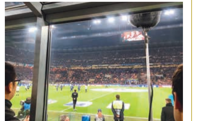
من مباراة «انترميلان» و«ايندهوفن»