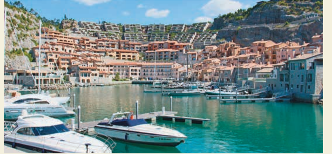
إطلالة مميزة على البحر الأدرياتيكي