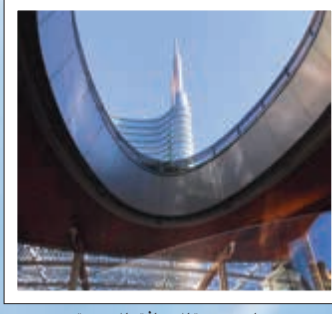
ميلانو مدينة الحدائق والعصرنة