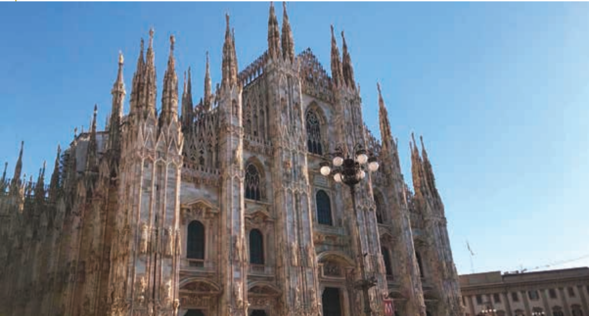
كاتدرائية الدومو أشهر معالم مدينة ميلانو