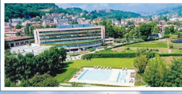
فندق شيراتون - بحيرة كومو