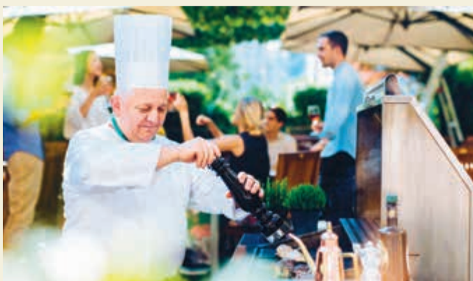
أرقى المأكولات الإيطالية والعالمية

جميع حمامات الغرف مصنوعة من الرخام الإيطالي. شعاع الفندق هو: كانك في بيتك.