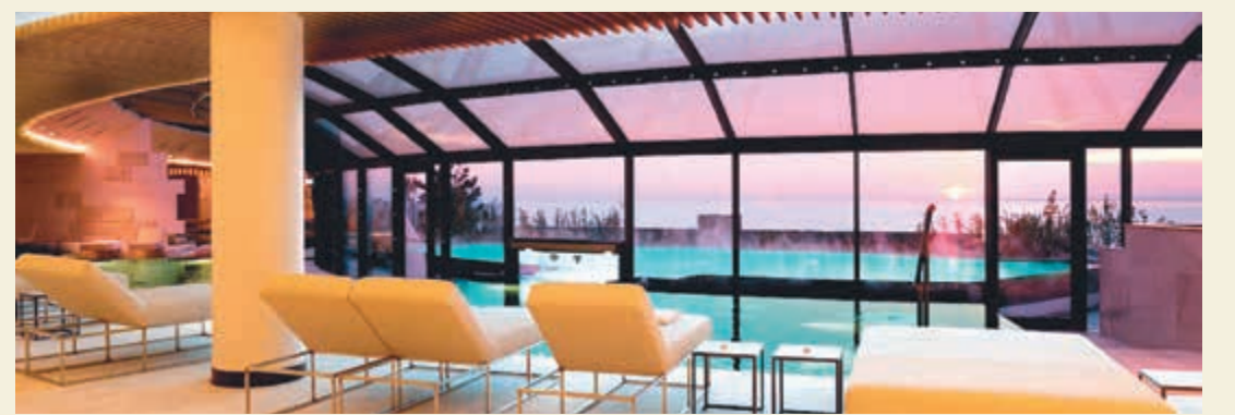
المنتجج يشتهر بأحد أشهر الاندية الصحية في العالم

شعار الفندق هو ما قاله عنه الشاعر الرومانسي راينر ماريا ريلكه أثناء إقامته: «الإقامة هنا أعجوبة» ليلخص تجربته الرومانسية على الشاطئ الأدرياتيكي ذي الرمال البيضاء المحيطة بالمنتجج. به 65 غرفة وجناحاً، وجميعها له إطلالة بحرية على هذا الشاطئ الأعجوبة. وعلى بعد خطوات يقع منتججج «بورتو بيكولو» الصحي الذي يمنح الضيوف تجربة رومانسية تتفاعل مع الطبيعة الرائعة التي تحيط بالفندق، لتمنح الضيوف خدمات وعلاجات طبية مفيدة.