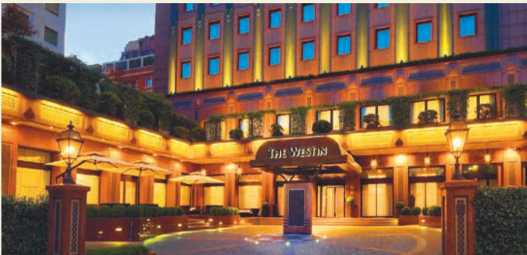
فندق وستن بالاس ميلانو في موقع مميز قرب الاماكن السياحية الرئيسية في المدينة

مصمم وفق معمار عصر النهضة الإيطالي كأحد القصور النيوكلاسيكية لأمرآة النهضة الأوروبية، على 12 طابقاً و231 غرفة. وتميزه واجهته المصنوعة من الرخام الأحمر، وبالفندق بلقونة واسعة جدا على سطحه بها إطلالة رائعة كامل مدينة ميلانو.