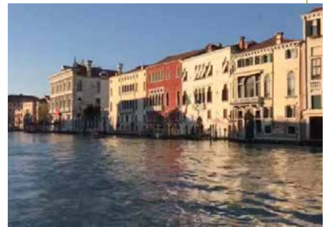
مدينة البندقية إحدى أشهر الوجهات السياحية في إيطاليا