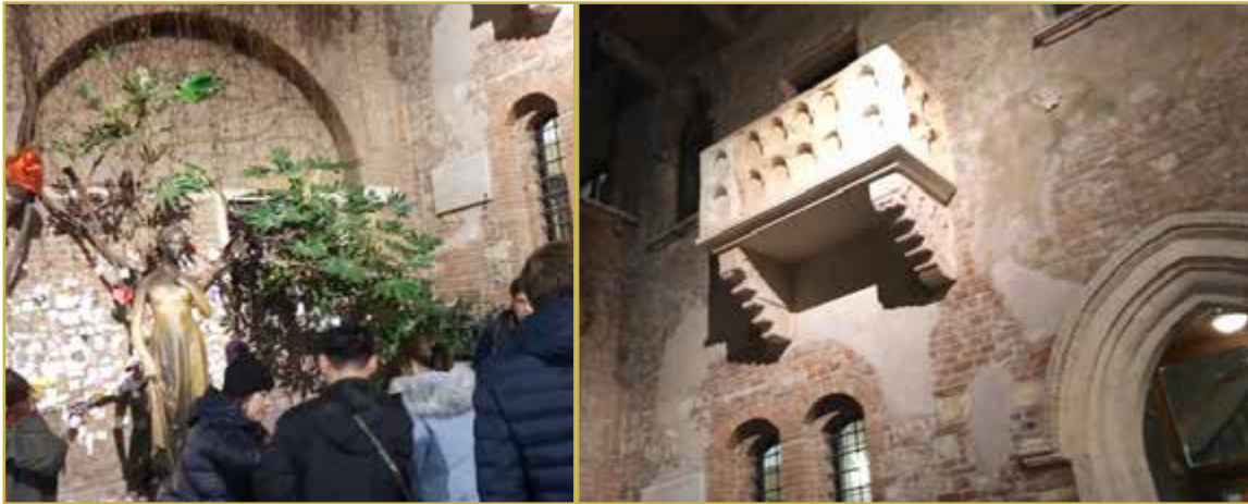
منزل جوليت حبيبة روميو وتمثالها في مدينة فيرونا