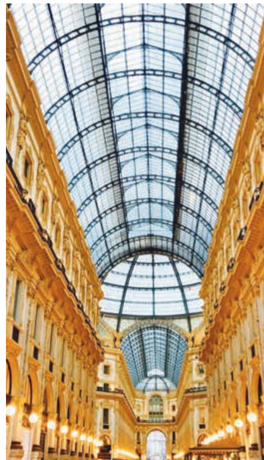
الغاليريا أقدم مول مغلق للتسوق في العالم