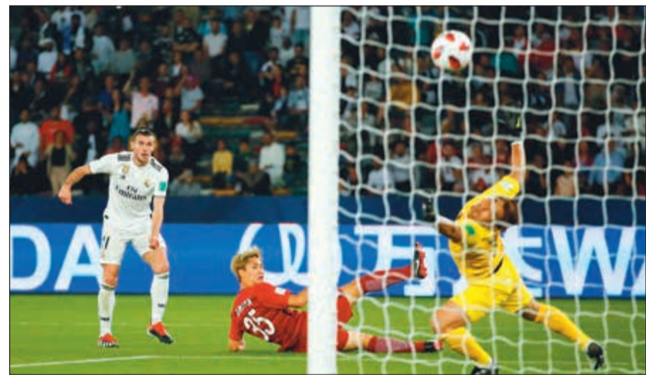
كرة نجم ريال مدريد غاريث بيل في طريقها إلى الشباك اليابانية (رويترز)

من جهته، تأهل فريق العين الإماراتي إلى النهائي بعد فوزه على ضيفه ريفر بلت الأرجنتيني في بركات الجزء الترجيحية 5-3 في المباراة التي جمعت بينهما أول من أمس على استاد مزاج بن زايد في الربع الذهبي للبطولة. وانتهى الوقت الأصلي بالتعادل بهدفين لمثلهما ليتم اللجوء إلى وقت إضافي على شوطين انتهى بالتعادل 3-3. وبعدها، قدم العين عرضاً رائعاً وحقق فوزاً كبيراً مستحقاً 0-3 على الترجي التونسي في مواجهة مفيدة بالدور الثاني للبطولة.