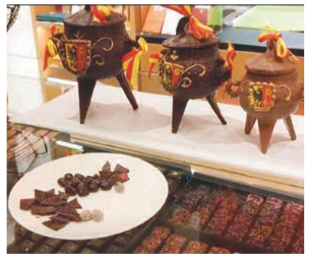
تفسير طناجر الشوكولاتة من طقوس عيد السلام في جنيف