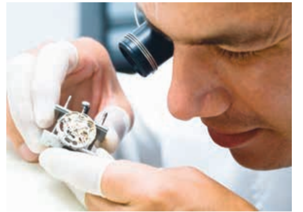
اصنع ساعتك بنفسك في جنيف