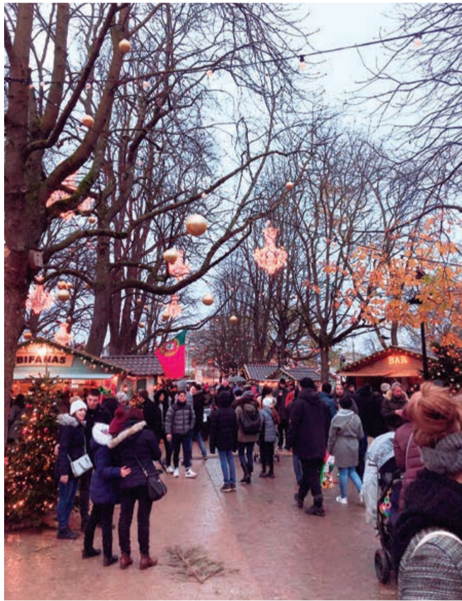
سوق عيد الميلاد

تقع جنيف جنوبا على ضفاف بحيرة ليمان في موقع إستراتيجي بين فرنسا وسويسرا، ويندفع إليها السياح على مدار العام، لكن لزيارتها في شهر ديسمبر رونقا خاصا، فقبل عروض رأس السنة ومهرجان الألعاب النارية يقام «سوق الكريسماس» الخاص بكل لوازم عيد الميلاد، وفي تاريخ 11-12 ديسمبر من كل عام تحيي المدينة ذكرى انتصارها على فرنسا بما يسمى بعيد السلام ورمزه الأبرز طناجر أو قذور الشوكولاتة، ويعود إلى 11 ديسمبر في العام 1602م، ففي ذلك التاريخ هاجم الفرنسيون