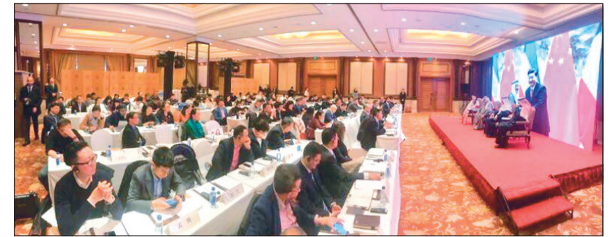
جانب من المنتدى

وفي كل المجالات. وأشار إلى أن جلسة المباحثات الرسمية الثنائية التي تناولت مجمل أوضاع العلاقات الثنائية الاستراتيجية المتميزة بين البلدين وسبل تطويرها وتعزيزها استمرت حتى ساعة متأخرة من مساء أول من أمس تخللتها مأدبة عشاء رسمية أقيمت على شرف الشيخ ناصر صباح الأحمد والوفد المرافق القائمة الحالية. وأوضح أنه تمت أيضا مناقشة سبل تدشين مجالات جديدة للتعاون تضاف إلى القائمة الحالية وخصوصا في ضوء استمرار المشاركة الصينية الفعالة في دعم وتنمية الفرص الواعدة للاستثمار في شمال الكويت. وأشاد بالاستقبال العالي المستوى والمباحثات العميقة التي حظي بها الشيخ ناصر صباح الأحمد من قبل القيادة الصينية العليا والتي تعكس تقديرا كبيرا للقيادة السياسية الكويتية. وقال أن الصين تفتن الدور المحوري والنظرة الاستراتيجية لصاحب السمو الأمير صباح الأحمد، وصمام أمان رئيسية لسلام وامن واستقرار منطقة الشرق الأوسط. ويشغل تشيانغ أيضا منصب عضو اللجنة المركزية الدائمة للحزب الشيوعي الحاكم وعضو المكتب السياسي الأعلى للحزب.