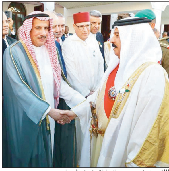
الملك حمد بن عيسى مصافحا الشيخ عزام الصباح

قال عميد السلك الدبلوماسي سفيرنا لدى مملكة البحرين الشيخ عزام الصباح إن الأعياد والأفراح في البحرين تمتد إلى كل بيت كويتي وأن البحرين دائما في قلب الكويت. وخلال لقائه بعاهل البحرين الملك حمد بن عيسى آل خليفة نقل الشيخ عزام الصباح لعاهل البحرين تهنئة صاحب السمو الأمير الشيخ صباح الأحمد بالعيد الوطني لبلادهم. من جهة أخرى، أكد السفير الشيخ عزام الصباح أن دول مجلس التعاون الخليجي كالبنين المرصوص في مواجهة التحديات، مضيافاً في مجلس التعاون بتمتع بخاصية فريدة وهي الديناميكية والقابلية للتطور لاستيعاب أي ظرف طارئ.