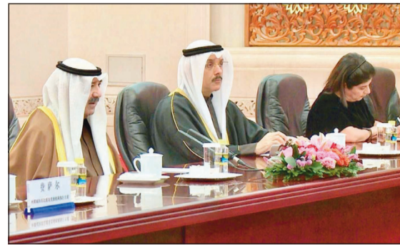
الشيخ ناصر صباح الأحمد والسفير سميح جوهري حيا خلال المباحثات

وفي كل المجالات. وأشار إلى أن جلسة المباحثات الرسمية الثنائية التي تناولت مجمل أوضاع العلاقات الثنائية الاستراتيجية المتميزة بين البلدين وسبل تطويرها وتعزيزها استمرت حتى ساعة متأخرة من مساء أول من أمس تخللتها مأدبة عشاء رسمية أقيمت على شرف الشيخ ناصر صباح الأحمد والوفد المرافق القائمة الحالية. وأوضح أنه تمت أيضا مناقشة سبل تدشين مجالات جديدة للتعاون تضاف إلى القائمة الحالية وخصوصا في ضوء استمرار المشاركة الصينية الفعالة في دعم وتنمية الفرص الواعدة للاستثمار في شمال الكويت. وأشاد بالاستقبال العالي المستوى والمباحثات العميقة التي حظي بها الشيخ ناصر صباح الأحمد من قبل القيادة الصينية العليا والتي تعكس تقديرا كبيرا للقيادة السياسية الكويتية. وقال أن الصين تفتن الدور المحوري والنظرة الاستراتيجية لصاحب السمو الأمير صباح الأحمد، وصمام أمان رئيسية لسلام وامن واستقرار منطقة الشرق الأوسط. ويشغل تشيانغ أيضا منصب عضو اللجنة المركزية الدائمة للحزب الشيوعي الحاكم وعضو المكتب السياسي الأعلى للحزب.