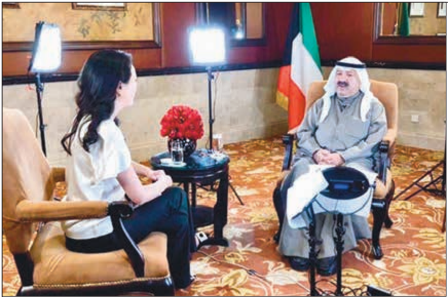
جانين من المقابلة التي أجراها الشيخ ناصر صباح الأحمد مع فريق برنامج «حديث مع قادة العالم» على قناة «هينيكس» الصينية

■ هاشم هاشم رئيساً تنفيذياً لمؤسسة البترول وإحالة القيادات النفطية التي أكملت سنوات الخدمة إلى التقاعد ■ قبول استقالة وزير النفط بخيت الرشيدى والموافقة على التجديد لطارق المزرم وكيلا لـ «الإعلام» 4 سنوات