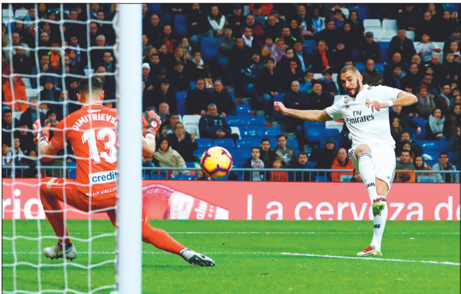
بنزيمة يسدد إحدى الكرات على مرمى رايو فايكانو

وكاد رايو فايكانو ينتزع التعادل لكنه لم يستغل فرصتين في اواخر المباراة عندما تصدى حارس ريال البلجيكي تيبو كورتوا لمحاولتي