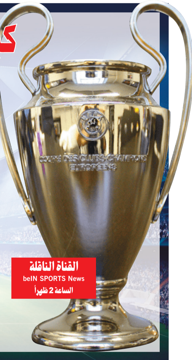
القناة الناقلة beIN SPORTS News الساعة 2 ظهراً

المركز الثاني يومي 12 و13 فبراير المقبل، أو يومي 19 و20 من الشهر نفسه، وتقام مباراة الإياب على ملعب أصحاب المراكز الأولى يومي 5 و6 مارس المقبل أو 12 و13 من الشهر نفسه.