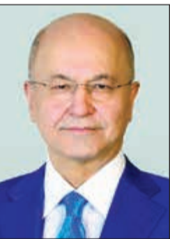
الرئيس العراقي برهم صالح

جدير بالذكر ان رئيس الوزراء العراقي عادل عبدالمهدي يحمل الجنسية الفرنسية، فيما يحمل العشرات من القيادات العراقية جنسيات من إيران وبريطانيا والولايات المتحدة وكندا وأستراليا وقطر والسويد والدنمارك وغيرها. ويعد الرئيس صالح أول رئيس جمهورية عراقي بعد عام 2003 يتخلى عن جنسية أجنبية استناداً إلى الدستور العراقي.