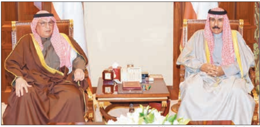
سمو ولي العهد الشيخ نواف الأحمد مستقبلاً الشيخ خالد الجراح