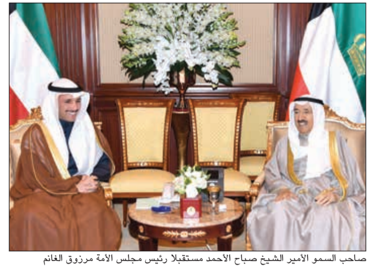
صاحب السمو الأمير الشيخ صباح الأحمد مستقبلاً رئيس مجلس الأمة مرزوق الغانم