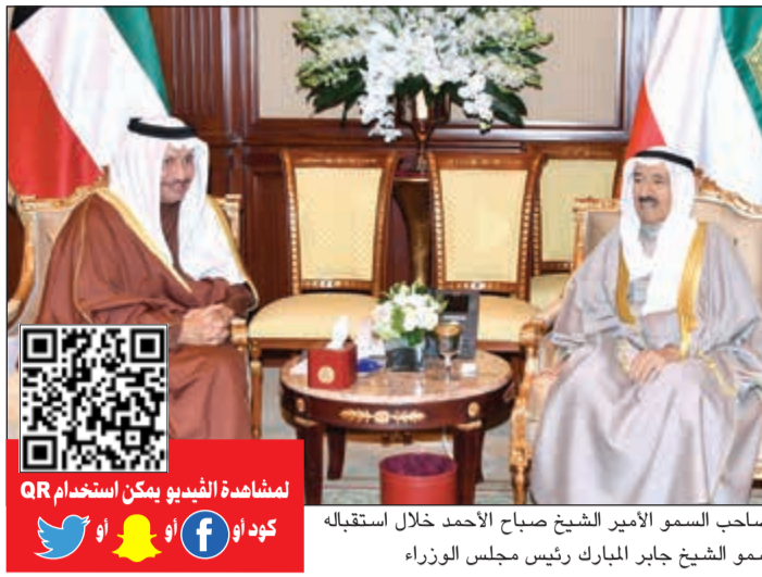
صاحب السمو الأمير الشيخ صباح الأحمد خلال استقباله سمو الشيخ جابر المبارك رئيس مجلس الوزراء

استقبل سمو ولي العهد الشيخ نواف الأحمد بقصر بيان صباح أمس رئيس مجلس الوزراء ووزير الخارجية خالد الجراح. واستقبل سمو ولي العهد نائب رئيس مجلس الوزراء ووزير الدولة لشؤون مجلس الوزراء أنس الصالح. كما استقبل سمو ولي العهد محافظ حولي الفريق أول متقاعد الشيخ أحمد النواف.