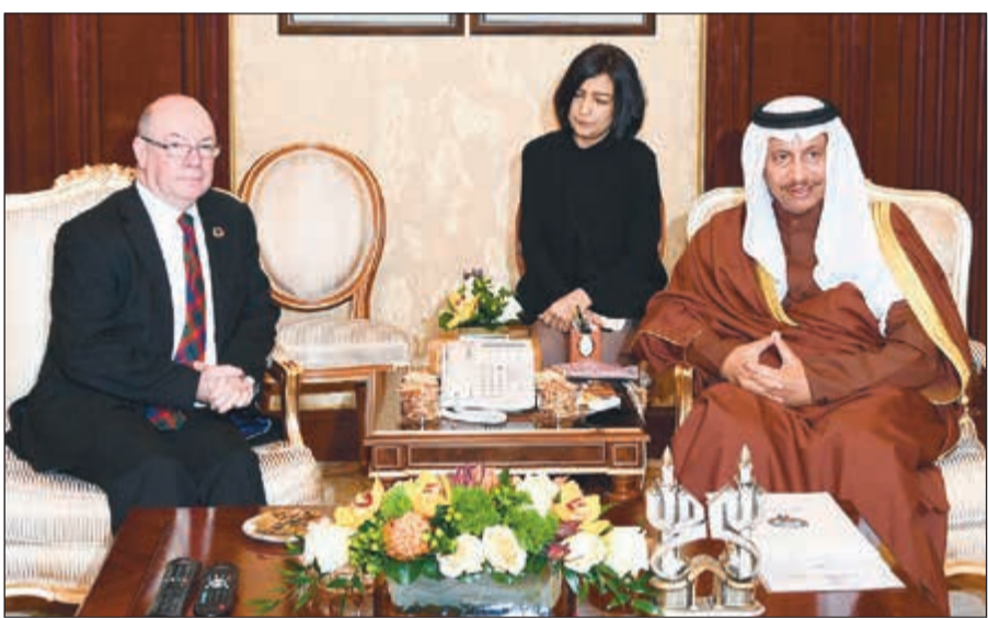
سمو رئيس الوزراء الشيخ جابر المبارك مستقبلاً وزير الدولة لشؤون الشرق الأوسط في وزارة الخارجية البريطانية

استقبل سمو رئيس مجلس الوزراء الشيخ جابر المبارك وبحضور نائب وزير الخارجية خالد الجار الله في قصر بيان أمس وزير الدولة لشؤون الشرق الأوسط بالملكة المتحدة الصديقة النائب الستير بيرت والوفد المرافق له وذلك بمناسبة زيارته للبلاد.