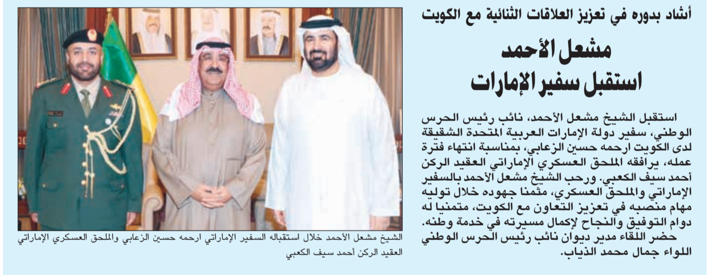
الشيخ مشعل الأحمد خلال استقباله السفير الإماراتي أرحم حسين الزعابي والملحق العسكري الإماراتي العقيد الركن أحمد سيف الكعبي

استقبل صاحب السمو الأمير الشيخ صباح الأحمد بقصر بيان صباح أمس سمو ولي العهد الشيخ نواف الأحمد مستقبلاً رئيس مجلس الأمة مرزوق الغانم. واستقبل سموه بقصر بيان صباح أمس سمو الشيخ جابر المبارك رئيس مجلس الوزراء. كما استقبل سموه بقصر بيان صباح أمس نائب رئيس مجلس الوزراء ووزير الخارجية الشيخ صباح الخالد ورئيس ائتلاف الوطنية بجمهورية العراق الشقيق د. إياد علاوي وذلك بمناسبة زيارته للبلاد. حضر المقابلة وزير شؤون الديوان الأميري الشيخ علي الجراح.