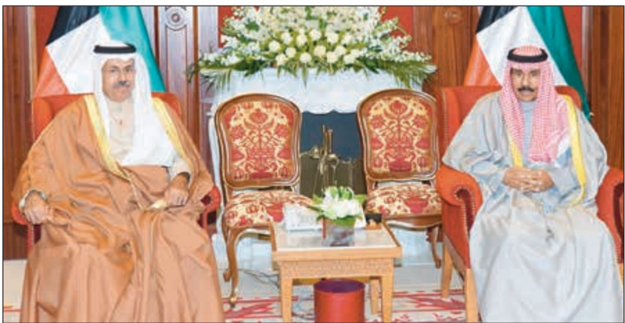
سمو ولي العهد الشيخ نواف الأحمد خلال استقباله محافظ حولي الفريق أول متقاعد الشيخ أحمد النواف

استقبل سمو ولي العهد الشيخ نواف الأحمد بقصر بيان صباح أمس رئيس مجلس الوزراء ووزير الخارجية خالد الجراح. واستقبل سمو ولي العهد نائب رئيس مجلس الوزراء ووزير الدولة لشؤون مجلس الوزراء أنس الصالح. كما استقبل سمو ولي العهد محافظ حولي الفريق أول متقاعد الشيخ أحمد النواف.