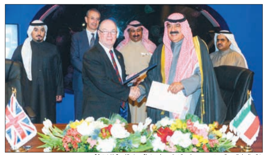
خالد الجارالله واليستر بيرت عقب توقيع على خطة عمل اللجنة المشتركة

عمل تتعلق بالتخطيط حيث وضع مع عدد من المؤسسات، واعرب الجانبان عن ارتياحهما لحجم للتعاون العسكري القائم بين البلدين وسير المحادثات الجارية بين المختصين حول مختلف مشاريع التعاون الدفاعي المطروحة من خلال تقديم الدعم والمساندة للجيش الكويتي في مساعي تعزيز قدراته وجاهزيته.