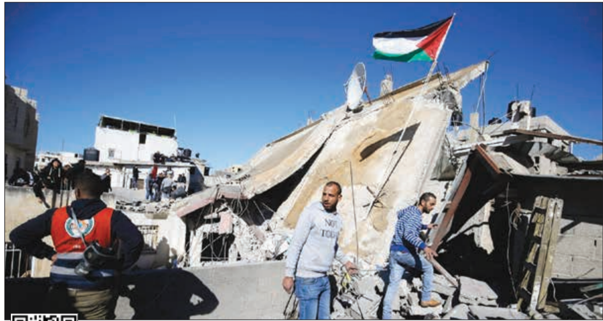
علم فلسطين يرفرف على انقاض منزل عائلة أبوحميد بمخيم الأمعري في رام الله الذي فجره الاحتلال أمس

وأكد موريسون أنه في المرحلة الانتقالية سيتم تأسيس مكتب للشؤون العسكرية والتجارية في غرب المدينة المقدسة. وقد عبر وزير الخارجية والمغتربين الفلسطيني رياض المالكي عن رفض القرار