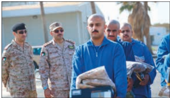
تسلم المهتمات العسكرية

استقبلت هيئة الخدمة الوطنية العسكرية صباح أمس (الدفعة 47) والتي تعتبر الدفعة الثانية من قانون الخدمة الوطنية العسكرية، وذلك بعد أن أتم المجنود جميع الإجراءات والفحوصات الطبية اللازمة لقبولهم والتحاقهم بهيئة الخدمة الوطنية العسكرية.