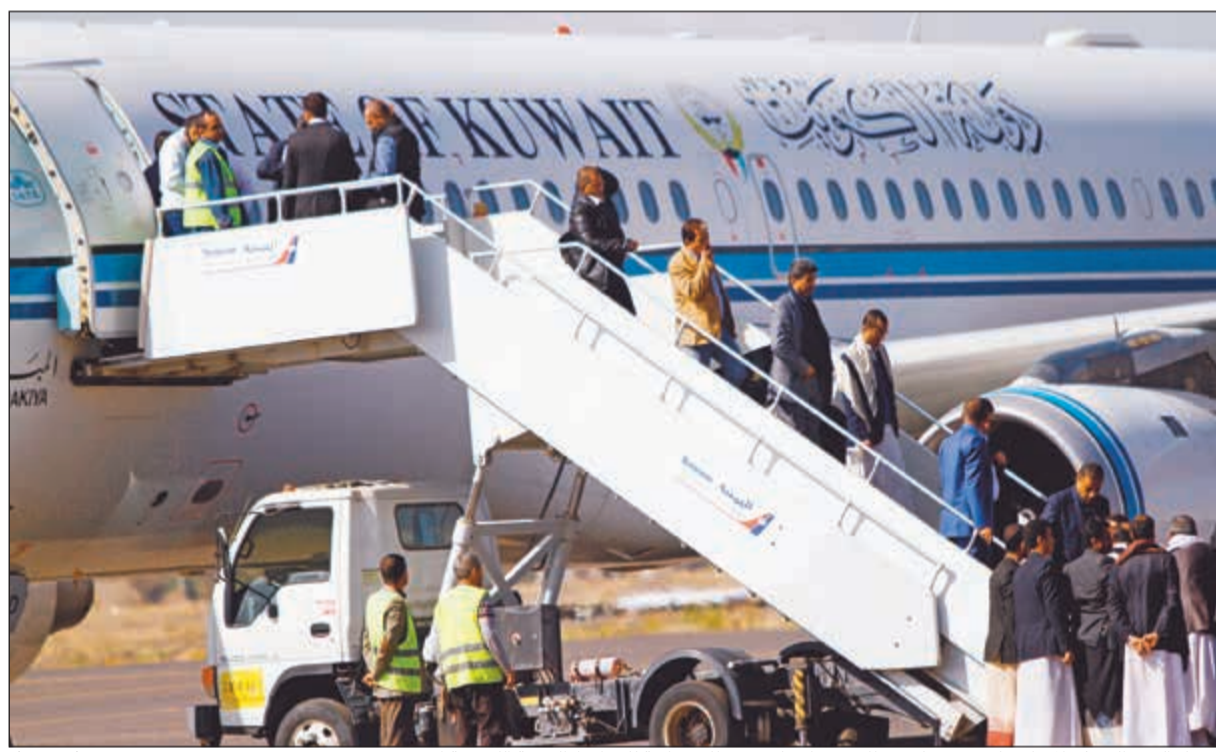
أعضاء الوفد الحوثي المشارك لدى وصولهم مطار صنعاء على متن طائرة تابعة للخطوط الجوية الكويتية أمس (رويترز)

عواصم - وكالات: أكد الأمين العام للأمم المتحدة، أنطونيو غوتيريس أن صاحب السمو الملكي الأمير محمد بن سلمان ولي العهد نائب رئيس مجلس الوزراء وزير الدفاع السعودي كان له إسهام «مهم للغاية» في الاتفاقات التي أسفرت عنها مشاورات السلام اليمنية في السويد. وقال نائب الناطق باسم الأمم المتحدة، فرحان حق، إن غوتيريس أكد أيضا أن الرئيس اليمني عبدربه منصور هادي «لعب دورا إيجابيا» في التوصل إلى اتفاق وقف إطلاق النار في محافظة الحديدة وموانئها خلال مشاورات السلام الأخيرة.