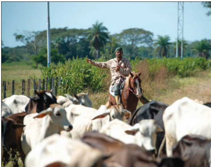
انتاج اللحوم تراجع في فنزويلا بسبب الهجوم على المشاة