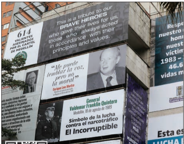
صور عدد من ضحايا إسكوبار على المبنى