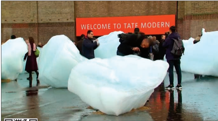
المنحوتات الثلجية جزء من مشروع فني يطلق عليه «آيس ووتش»