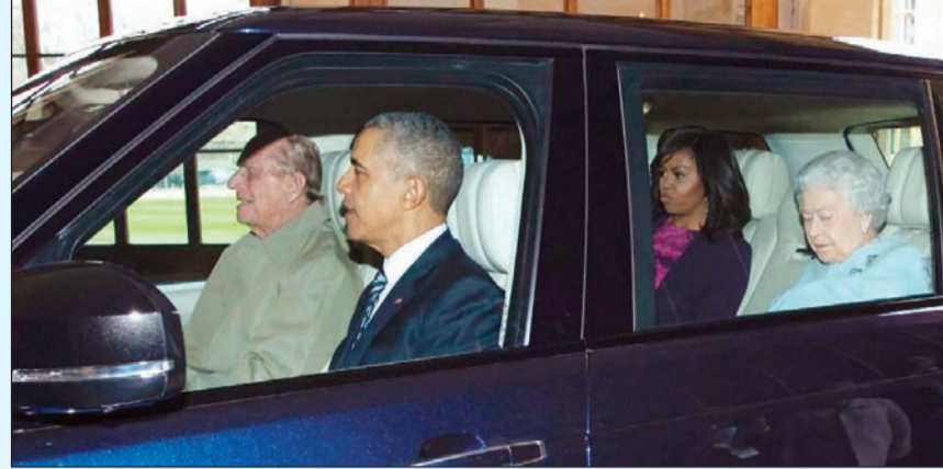
الأمير فيليب والملكة إليزابيث عندما استقبلا باراك أوباما وزوجته ميشيل

لندن - د.ب.: رغم أنها لم تقطع أكثر من 3000 ميل، بحسب لوحة العدادات، قرر الأمير فيليب زوج ملكة بريطانيا طرح سيارة ملكية طراز «رينج روفر» للبيع. وإذا كان الهاجس الأول عند شراء سيارة مستعملة هو مدى عناية آخر مالك للسيارة بها، فإن شراء سيارة ملوكة للأمير فيليب يعني، بالتأكيد، ضمان أن السيارة تتمتع بجميع أنواع الرعاية. ويبلغ عمر السيارة «رينج روفر» 4,4 إس.دي في 8، المعروضة للبيع عامين فقط، وقد تم طرحها للبيع على موقع «أوتو تريند» للتجارة الإلكترونية على موقع الإنترنت بسعر 129850 جنيه إسترليني (143 ألف دولار)، حيث أشار الموقع إلى أن السيارة كانت تعامل معاملة السيارات الملكية والديبلوماسية.