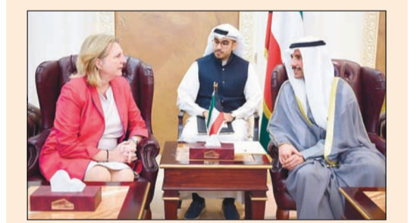
الرئيس مرزوق الغانم مع وزيرة خارجية النمسا

3 - التقرير السابع والعشرون للجنة الشؤون الخارجية عن مشروع قانون بموافقة على