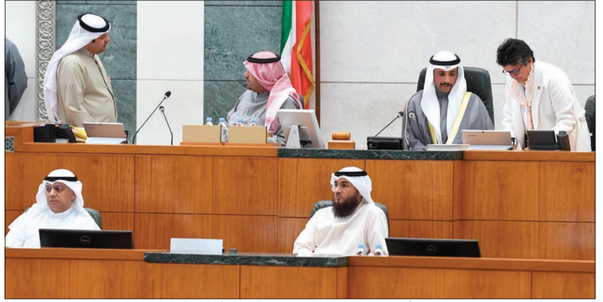
رئيس مجلس الأمة مرزوق الغانم وصفاء الهاشم وأنس الصالح وفيفصل الكندري على المنصة وتبدو الأمانة العامة

الالتفاقيات، مثل التوقيع على الأحرف الأولى أو الاتفاقيات الثنائية. أحمد الفضل: كل الشكر للجنة الأولويات التي أعدت جدول الأعمال ورتبناها واستعملناها. وكذلك نشكر النائب السابق حمد سيف الهرشاني الذي كان رئيسا للجنة الخارجية في الدور السابق.