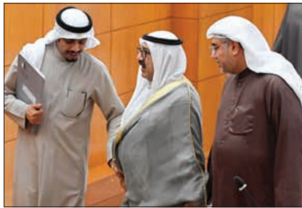
الشيخ ناصر صباح الأحمد متوسطا خالد الشطي وماجد المطيري