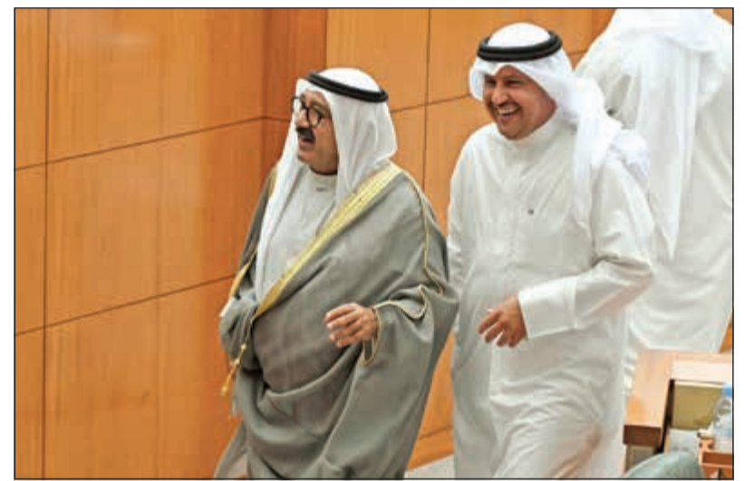
الشيخ ناصر صباح الأحمد مع طلال الجلال

عدم موافقة 1. طلبات المناقشة انتقل المجلس إلى مناقشة طلب من الأعضاء بشأن ندب مجموعة من العسكريين، ونص الطلب على ما يلي: السيد رئيس مجلس الأمة المحترم تحية طيبة وبعد... نشرت جريدة القبس بعددها الصادر بتاريخ 18/10/2018 في صدر صفحتها الأولى، قرار النائب الأول لرئيس مجلس الوزراء ووزير الدفاع الشيخ ناصر صباح الأحمد شافاه الله وعافاه وأعادته إلى البلاد سالما، قرارا بسحب المقاتلين لأعضاء مجلس الأمة والمقدر عددهم بـ 560 عسكريا من مختلف الرتب، الأمر الذي يعني إعادتهم إلى العمل بالوحدات العسكرية التابعة لها، وإذ نشيد بهذا القرار الشجاع ونشكره عليه، وتوافقا مع الواقع فقد أصاب هذا القرار غايته في إعادة قطاعات وزارة الدفاع المختلفة بخبرات وتخصصات العسكريين المنتدبين بهذا العدد خاصة والغالب منهم قد تحصل على الخبرات الميدانية والتدريبات والدورات العسكرية مما يؤكد أن عملهم في مواقعهم الأصلية أجدى من ابتعادهم عن أعمال الوزارة بما قد يترتب عليه من آثار سلبية على أداء بعض القطاعات التي تم انتدابهم منها. ويتصل بهذا الإجراء معرفة ما الأعداد التي تمت الموافقة على انتدابهم وفرزهم للعمل لدى الأعضاء من الجهات الأخرى مثل وزارة الداخلية والحرس الوطني وأهمية استمرار الجهات التابعة لها بالإفادة من خبراتهم مع أهمية الحاجة إلى تحديد أعدادهم ومدد انتدابهم من هذه الجهات ومناقشة إجراءات انتدابهم ومدى تقيدها