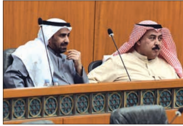
خلف مبيير ود.جمود الخضير