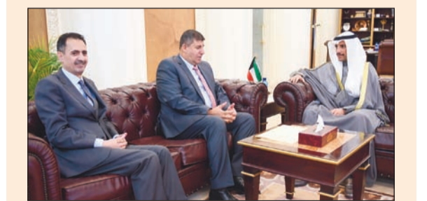
الغانم مع عضو البرلمان في مملكة الأردن

الغانم يستقبل وزيرة خارجية النمسا ورئيس لجنة فلسطين بالبرلمان الأردني ويعزي فرنسا بضحايا ستراسبورغ